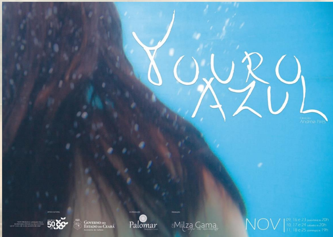
Cartaz A3 e Banner 120 x 90 cm