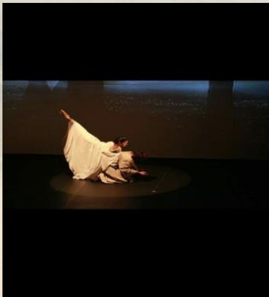
O Mais Belo dos Homens (2010 e 2011) Teatro José de Alencar e Via Sul