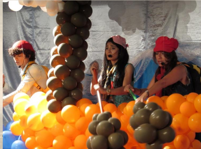
Barquinho (2015) Teatro Nadir Papi Saboya