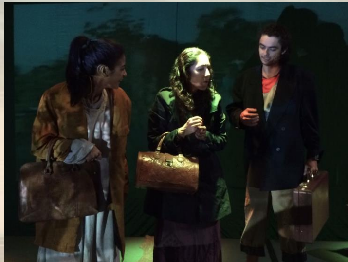
Esperança (2016) Ponta Mar Hotel