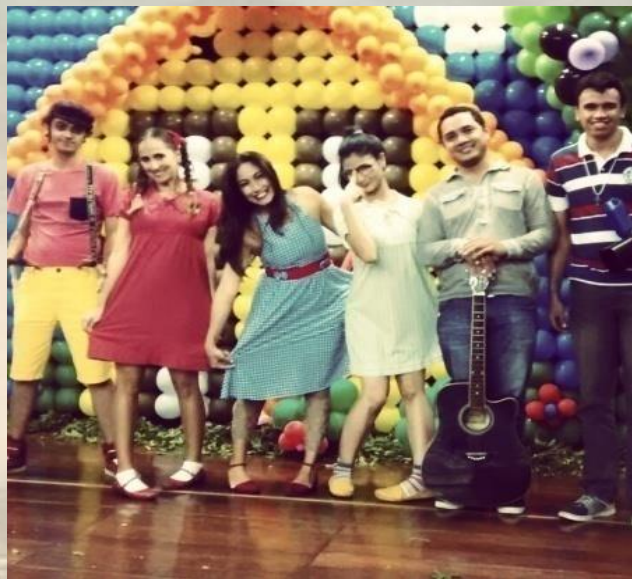
O Mundo de Clara (2014) Teatro Nadir Papi Saboya