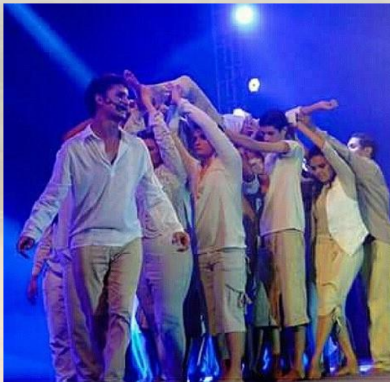
Abraço (2016) Teatro Nadir Papi Saboya