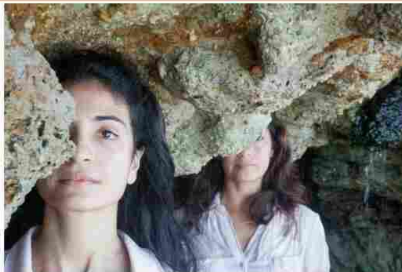
Espectáculo "Touro Azul", neste sábado (11) e domingo (12), Teatro Sesc Iracema.

29. O espetáculo "Touro Azul", com inspiração no poema "Mar Absoluto" de Cecília Meireles, está em cartaz neste sábado (11), às 20h e domingo (12), a partir das 19h, no Teatro Sesc Iracema. Entrada gratuita.