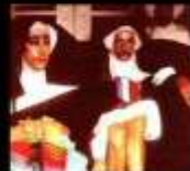
00h - As Budistas Venereas