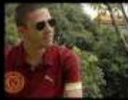
22h - Wide Open Mind

FRINGE DIGITAL INTERNACIONAL DE PAR EM PAR DE DANÇA DO CEARÁ 2012 FRINGE