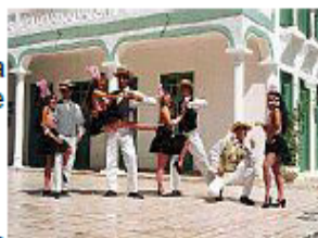
Balé Folclórico Arte Popular de Fortaleza: turnês na Europa e temporada no Hotel Brasil Residence

Um verdadeiro apanhado dos ritmos mais tradicionais da rica cultura brasileira é o que tem a oferecer os bailarinos do Balé Folclórico Arte Popular de Fortaleza. Todas as terças-feiras, com previsão para prosseguir até o mês de abril, o restaurante do Hotel Brasil Tropical Residence abre suas portas para o espetáculo Brasil em Festa .