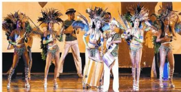
OS MOMENTOS DAS PERFORMANCES do Balé Folclórico Arte Popular de Fortaleza: encontro de diversas manifestações coreográficas brasileiras e internacionais