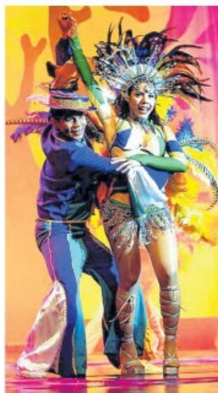
BALÉ Folclórico Arte Popular completa 30 anos de fundação

OP - Atualmente o Balé Folclórico Arte Popular de Fortaleza possui quantos membros?