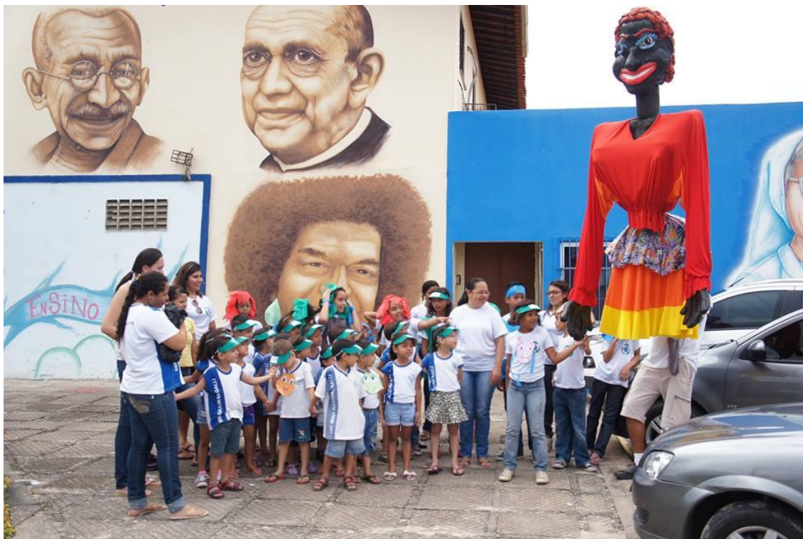
Boneca feita pela crianças do projeto na OFICINA DE CONFECÇÃO DE BONECOS - (visita aos alunos da Escola de Ensino Fundamental Irmã Giuliana Galli (bairro Itaperi)