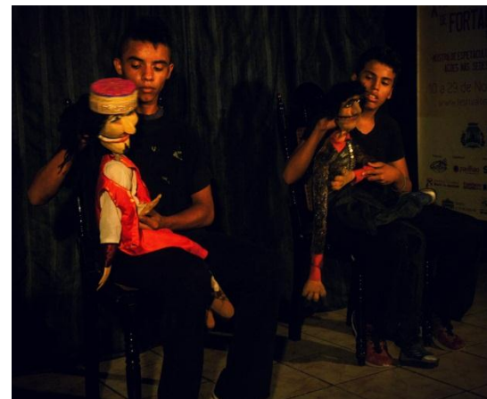
BONECOS DE BALCÃO (experimentos para ventriloquia) na sede do Formosura