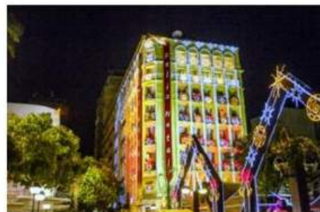
A mostra é parte das atividades do Ceará Natal de Luz e fecha o ciclo natalino

A XI Mostra Estadual Ceará Natal de Luz acontece nesta sexta-feira (6). Dia de Reis, programação especial começa às 8h e se estende até às 19h na Praça do Ferreira , no Centro de Fortaleza. Como parte das atividades do Ceará Natal de Luz, a mostra fecha o ciclo natalino, destacando as manifestações regionais , com a participação de grupos de pastoril, boi, reisado, lapinha viva, presépio e fandango. Este ano, o evento homenageia os mestres Piauí e Pedro Boca Rica (este, in memoriam).