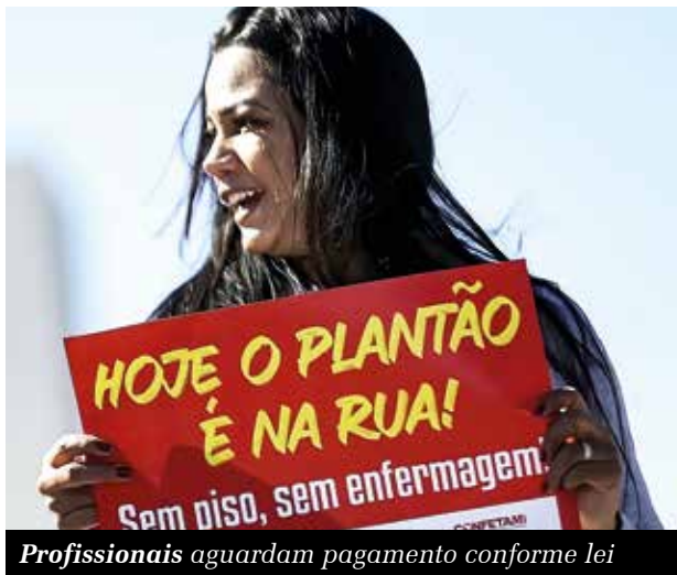
Profissionais aguardam pagamento conforme lei

O Coren ainda notificou três prefeituras cearenses para readequarem o salário oferecido em seleções e concursos públicos. Enquanto o piso nacional estabelece salário de R$ 4.750 para enfermeiros e R$ 3.325 para técnicos, a Prefeitura de Barro oferecia salários que variavam