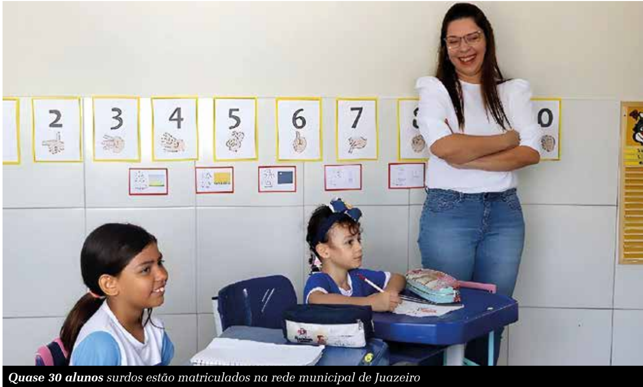
Quase 30 alunos surdos estão matriculados na rede municipal de Juazeiro

Comunidade surda luta por inclusão e instalação escola bilíngue