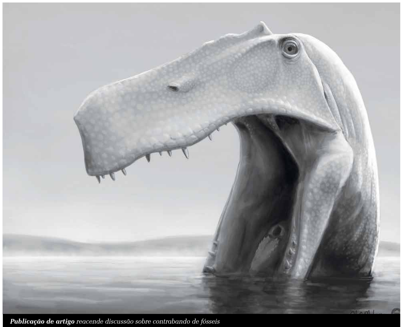
Publicação de artigo reacende discussão sobre contrabando de fósseis