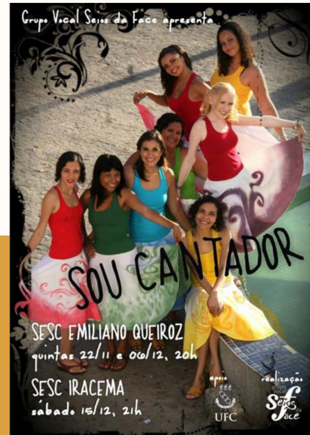
Show Sou Cantador, SESC Emiliano Queiroz, 2012.