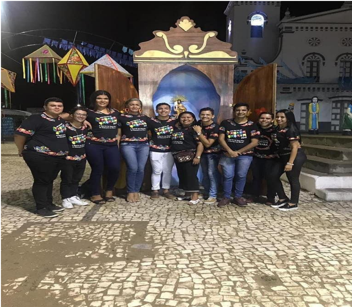
7/8-PRODUÇÃO DA ETAPA CEARÁ JUNINO SERTÃO CENTRAL