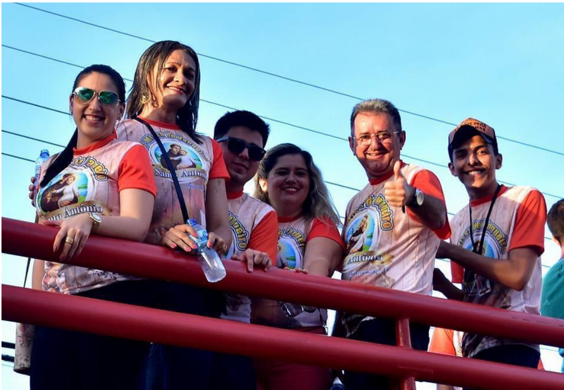
9/10/11- CORAL DA MISSA DO VAQUEIRO + CAVALGADA