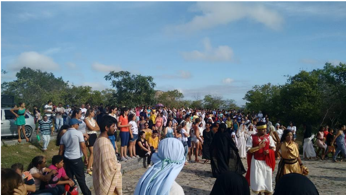
27/28/20/30- ENCENAÇÃO DA PAIXÃO DE CRISTO