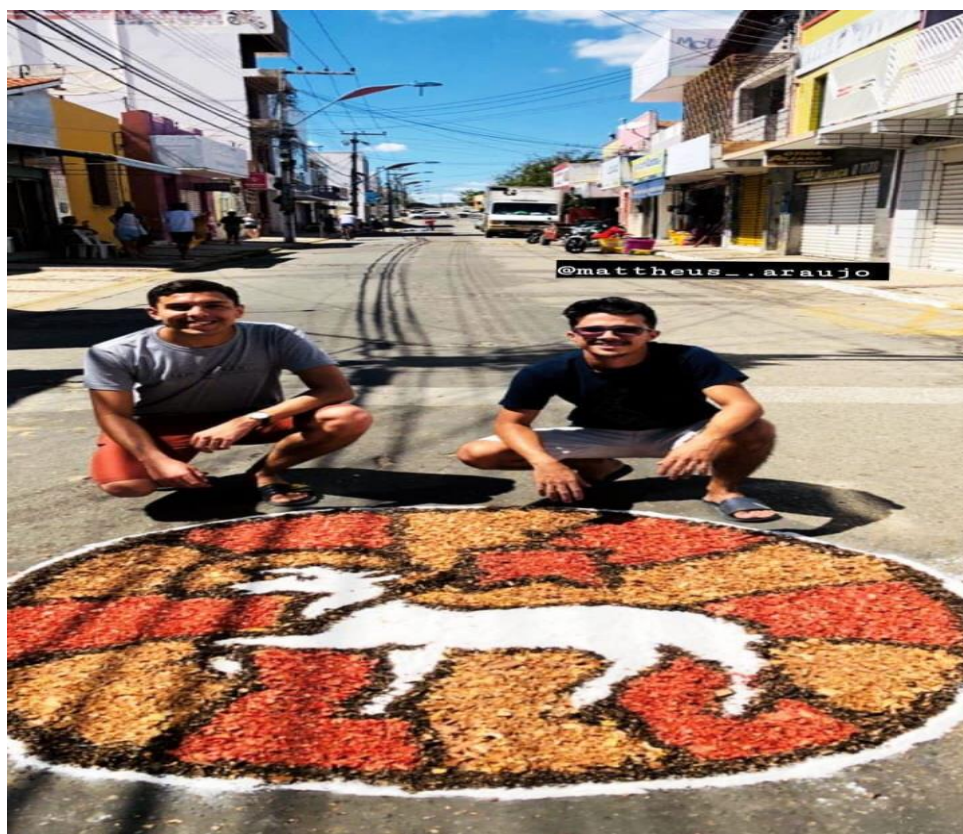
19/20/21/22- CONFECÃO DOS TAPETES PARA A PROCISSÃO DE CORPUS CHRIST