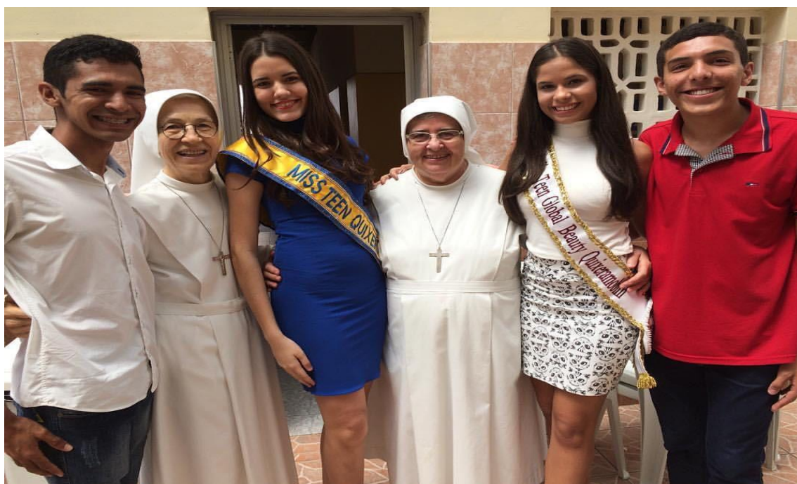
01- COM A EQUIPE E MISSES TEENS 2016/2017