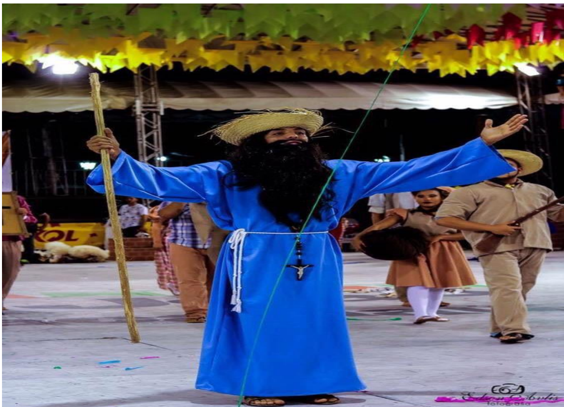
3/4/5/6/- PERSONAGEM PRINCIPAL DO GRUPO JUNINO ARRAIÁ DO CONSELHEIRO