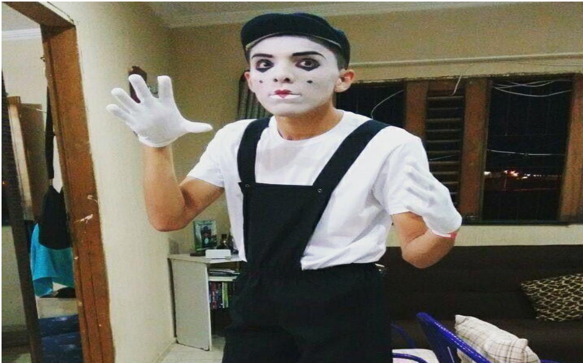
02- ENCENAÇÃO TEATRAL COM MIMICAS