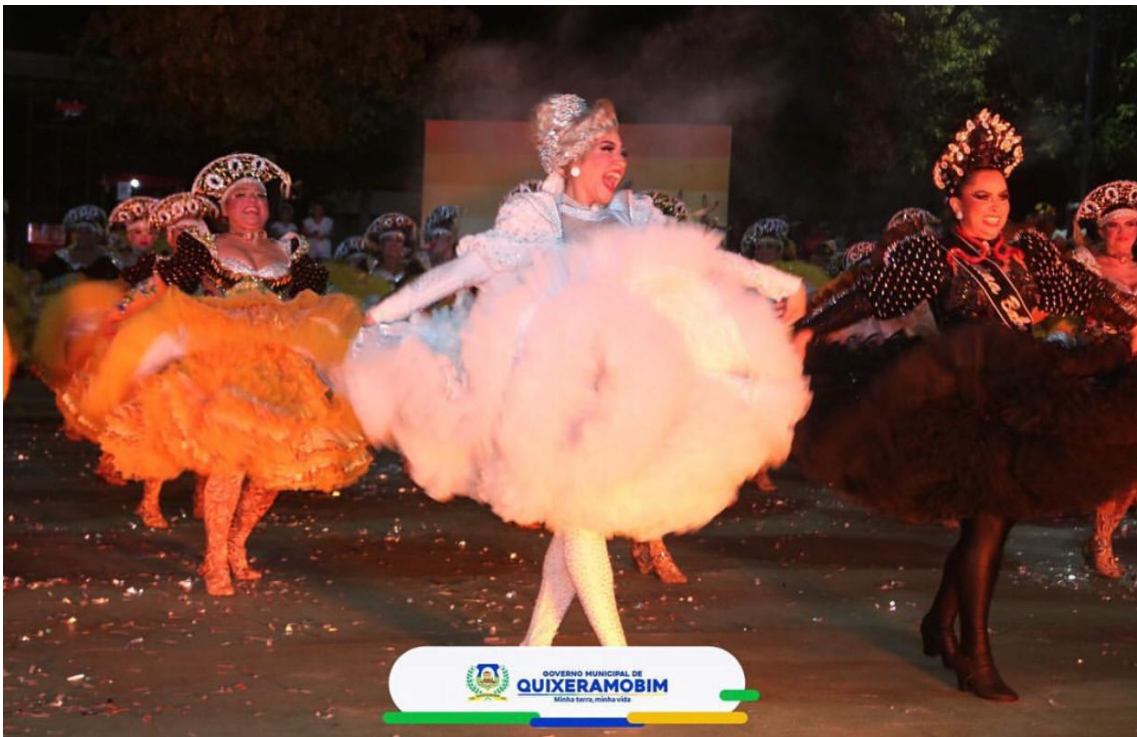
23/24/25/26- 1º FESTIVAL ARRAIAL DO CONSELHEIRO