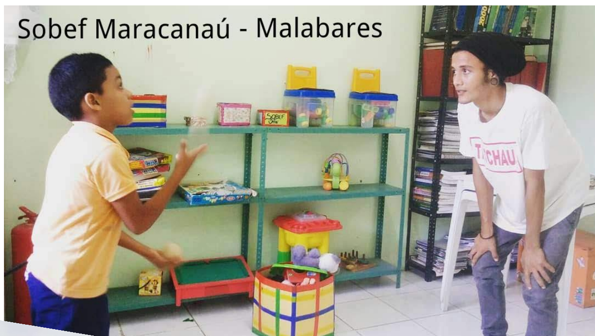
Sobef Maracanaú - Malabares