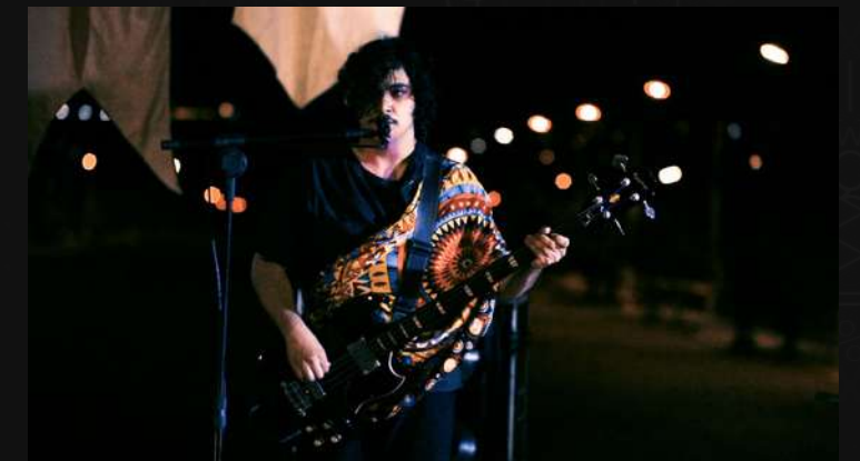
SCREENSHOTS DO FILME POST HOMINUM