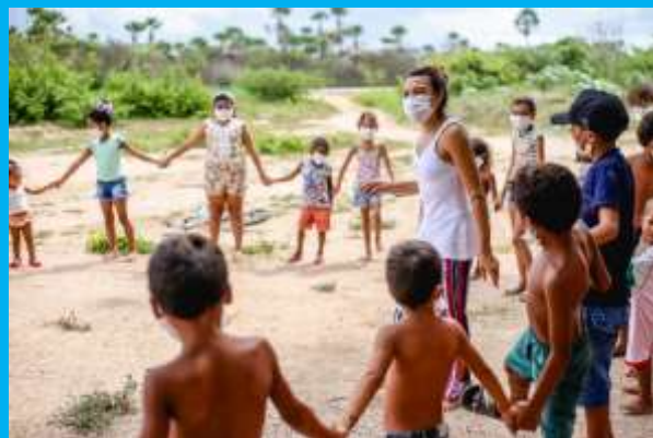
CIRANDANDO NO TERREIRO