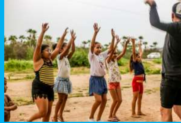
OFICINA DE DANÇA