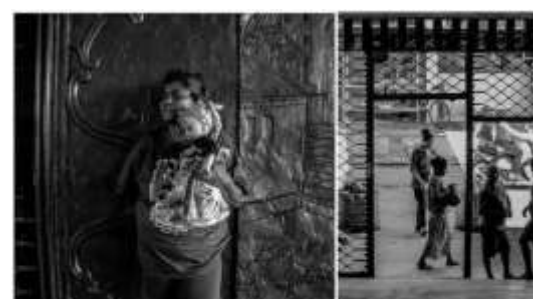
Da série Sinfonia cotidiana