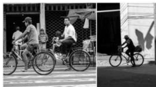
Da série Sinfonia cotidiana