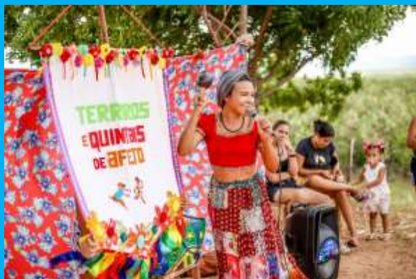
CONTAÇÃO DE HISTÓRIAS