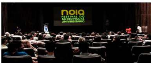
A 19ª edição do Festival NOIA recebeu inscrição de 244 projetos de todo o Brasil.