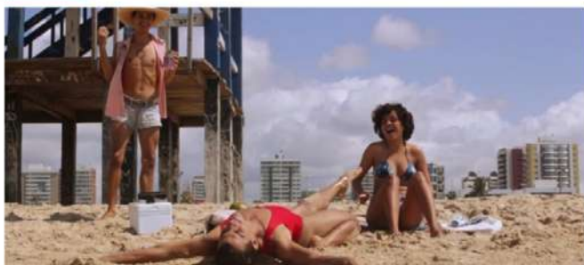
Onde a fé tem nos levado (Dir. Neto Astório)

Luz, câmera, ação! Um dos maiores acontecimentos do audiovisual universitário brasileiro entra em cena. O 19º NOIA – Festival do Audiovisual Universitário acontece de 30 de novembro a 04 de dezembro. Este ano, devido à pandemia do Covid-19, o Festival realiza sua edição em formato online. Na programação, que é totalmente gratuita, mostras competitivas de curtas-metragens (nacional e cearense), exposição de fotografia e shows de bandas universitárias, sessão NOIA KIDS com Acessibilidade (com legendagem para surdos e ensurdecidos e tradução em Libras), workshops, debates pós-exibição, Seminário de Sustentabilidade, e Seminário e Fórum do Audiovisual Universitário. Tudo será transmitido pelo YouTube do Festival NOIA e do O POV0 Online.