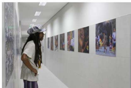
📷 O Festival NOIA acontece há 18 anos e é um espaço híbrido de interferências artísticas do áudio, imagem estática e imagem em movimento, onde se encontram Cinema, Fotografia e Música.

O Festival NOIA acontece há 18 anos e é um espaço híbrido de interferências artísticas de áudio, imagem estática e imagem em movimento, onde se encontram Cinema, Fotografia e Música. O intuito do evento é promover a produção audiovisual realizada por estudantes brasileiros, a profissionalização de jovens e adultos por meio da Cultura, a discussão sobre o fazer audiovisual e a democratização do acesso. O evento será realizado em novembro e as inscrições estão abertas até o dia 30 de setembro.