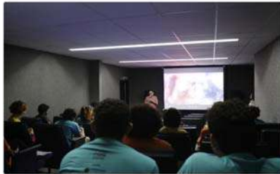
Festival NOIA: André Queiroz