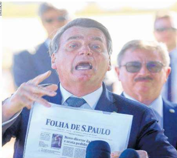
Presidente Jair Bolsonaro critica manchete da Folha de São Paulo diante de jornalistas, no Palácio da Alvorada