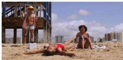
(Imagem: filme "Onde a fé tem nos levados", de Nieto Astério (UFS - São Cristóvão/SE))

23 DE NOVEMBRO DE 2020 - 10:27 | #Universo #Programação