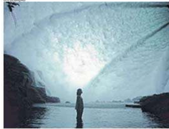
1 "VALVILA", de Sara Benvenuto, está concorrendo na Mostra Cearense de Cinema do Festival Noia