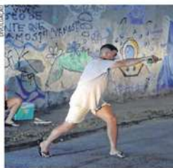
"VAGABUNDOS Etcetera", dirigido por Rafael Brasileiro, venceu a categoria de Melhor Filme Cearense pelo Juri Oficial

| AUDIOVISUAL | Encerramento do 19º NOIA aconteceu ontem. Conheça os vencedores