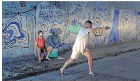
3 O GRUPO "Mente Quintal Club" está concorrendo na "Mostra de Bandas" da 19ª edição do Noia - Festival do Audiovisual Universitário

[ 19ª EDIÇÃO ] Adaptado ao formato virtual, o Noia - Festival do Audiovisual Universitário começa hoje, 30, com mostras competitivas de curta-metragens, exposição de fotografias e shows de bandas universitárias