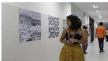
Os projetos inscritos no Festival NOIA concorrem nas categorias: curta-metragem, fotografia e banda.

Os curtas-metragens concorrem em 16 categorias, incluindo melhor curta-metragem, os vencedores são escolhidos pelo júri oficial do NOIA e pelo júri da crítica, formado por membros da Acecine, Associação Cearense de Críticos de Cinema. Além deles, a platela pode escolher o seu filme favorito através do prêmio do júri popular. A lista completa das categorias pode ser conferida no site festivalnoia.com.br .