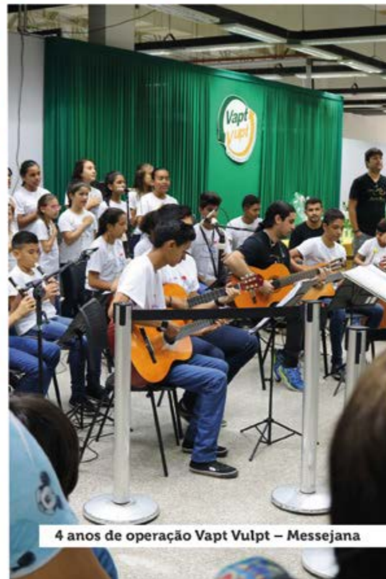
4 anos de operação Vapt Vulpt - Messejana