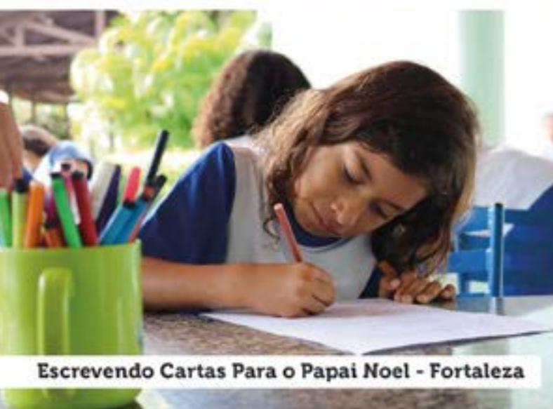
Escrevendo Cartas Para o Papai Noel - Fortaleza

de Saúde bucal – Uniodonto; Projeto Educar para Ser – Grupo de mães; Reunião de pais; Atendimento às famílias pelo CRAS; Visita ao Museu do Escravo Liberto – Redenção; VI Mostra Cultural – Unesco – Década internacional do Afro Descendente; Visita a Casa José de Alencar; Grupos de Vivência Foram formadas; Seminário Captação De Recursos – Instituto Filantropia – SP; Seminário Em Recife; encontro Pea/unesco; Colônia de férias; Campeonato de Futebol Comunitário com escolas parceiras; Visita a Exposição Santos Dumont – Espaço Cultural da UNIFOR; Independência do Brasil – Tema integrador; Dia do Professor e Dia das Crianças - Tema integrador; Escrevendo cartas para o papai noel; Ação SEJUS; Elaboração de Projetos e Captação de Recursos; E -Social e segurança e saúde no trabalho, desmistificando as dificuldades; Fórum Interamericano de Filantropia Estratégica – FIPI 2018; 10º Festival ABCR.