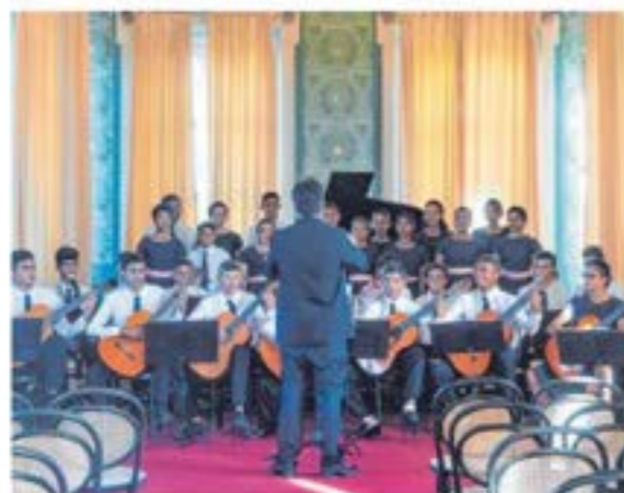
RECITAL A orquestra da Fundação Raimundo Fagner retorna ao município de origem, Oriz, com o espetáculo "De Sombra e Luz - Recital de Música Barroca". As apresentações acontecerão amanhã (22), às 19h00, na Catedral Episcopal Presbiteriana da 35, às 19h, na Igreja Matriz.