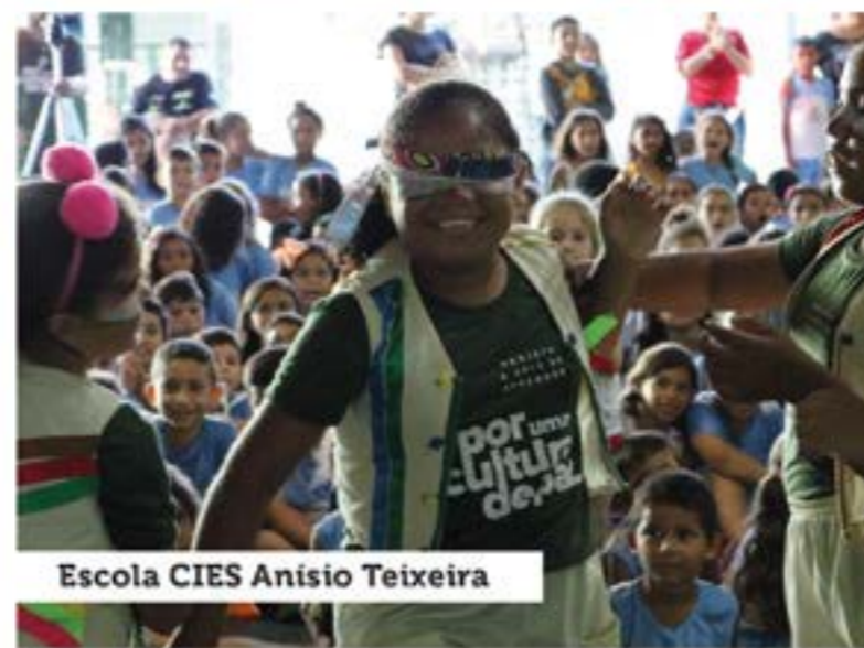
Escola CIES Anísio Teixeira