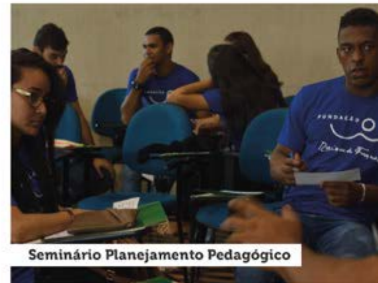
Seminário Planejamento Pedagógico

Encontro Pedagógico 2018; Planejamento por núcleos; Seleção de novatos; Reunião de pais dos novatos; Carnaval; Reunião de pais veteranos; Atividade resgatando valores; Palestra da semana da árvore; Caminhada da semana da árvore; 1º Café criativo; Campanha de vacinação H1N1; Palestra sobre o combate a exploração sexual; Caminhada contra a exploração sexual contra