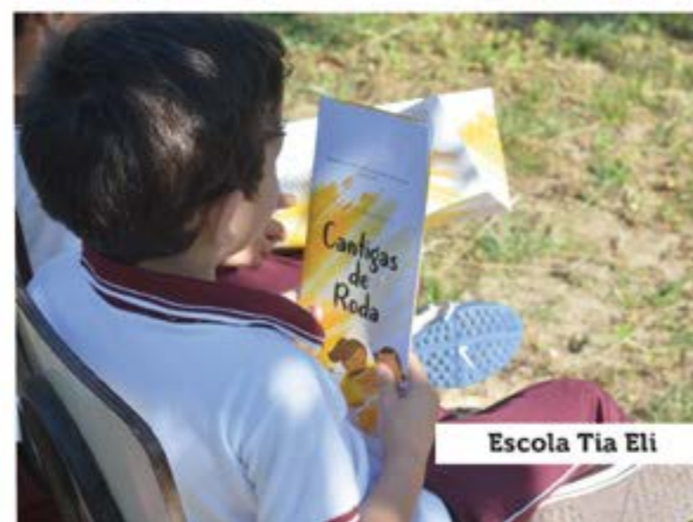
Escola Tia Eli