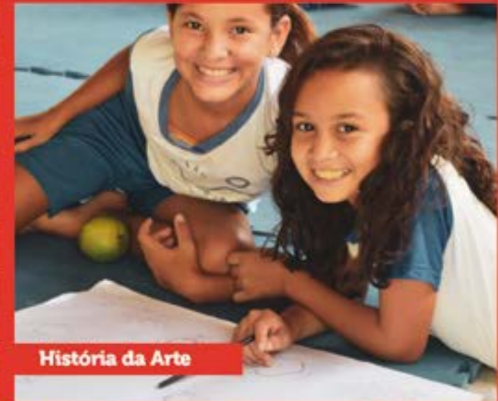
História da Arte