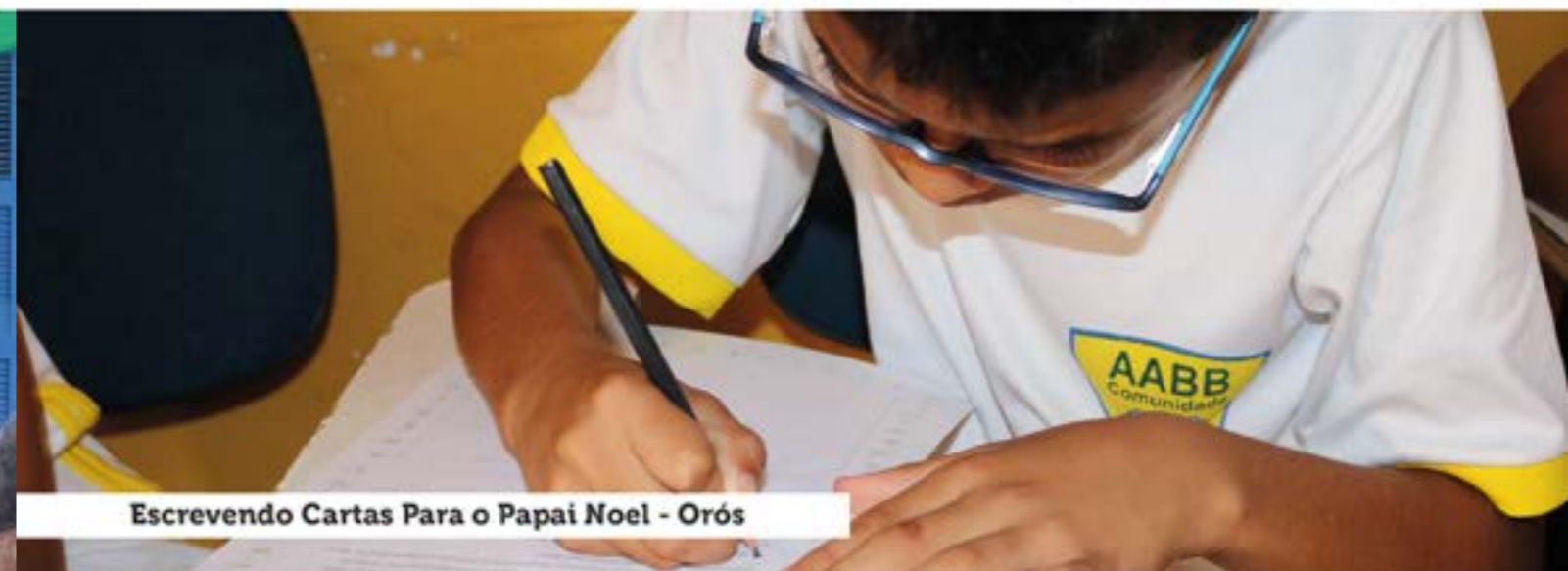
Escrevendo Cartas Para o Papai Noel - Orós