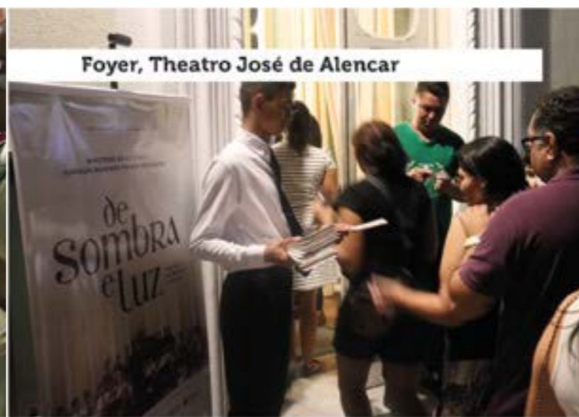
Foyer, Theatro José de Alencar