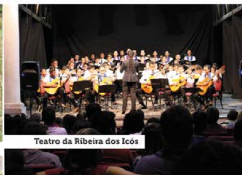
Teatro da Ribeira dos Icós