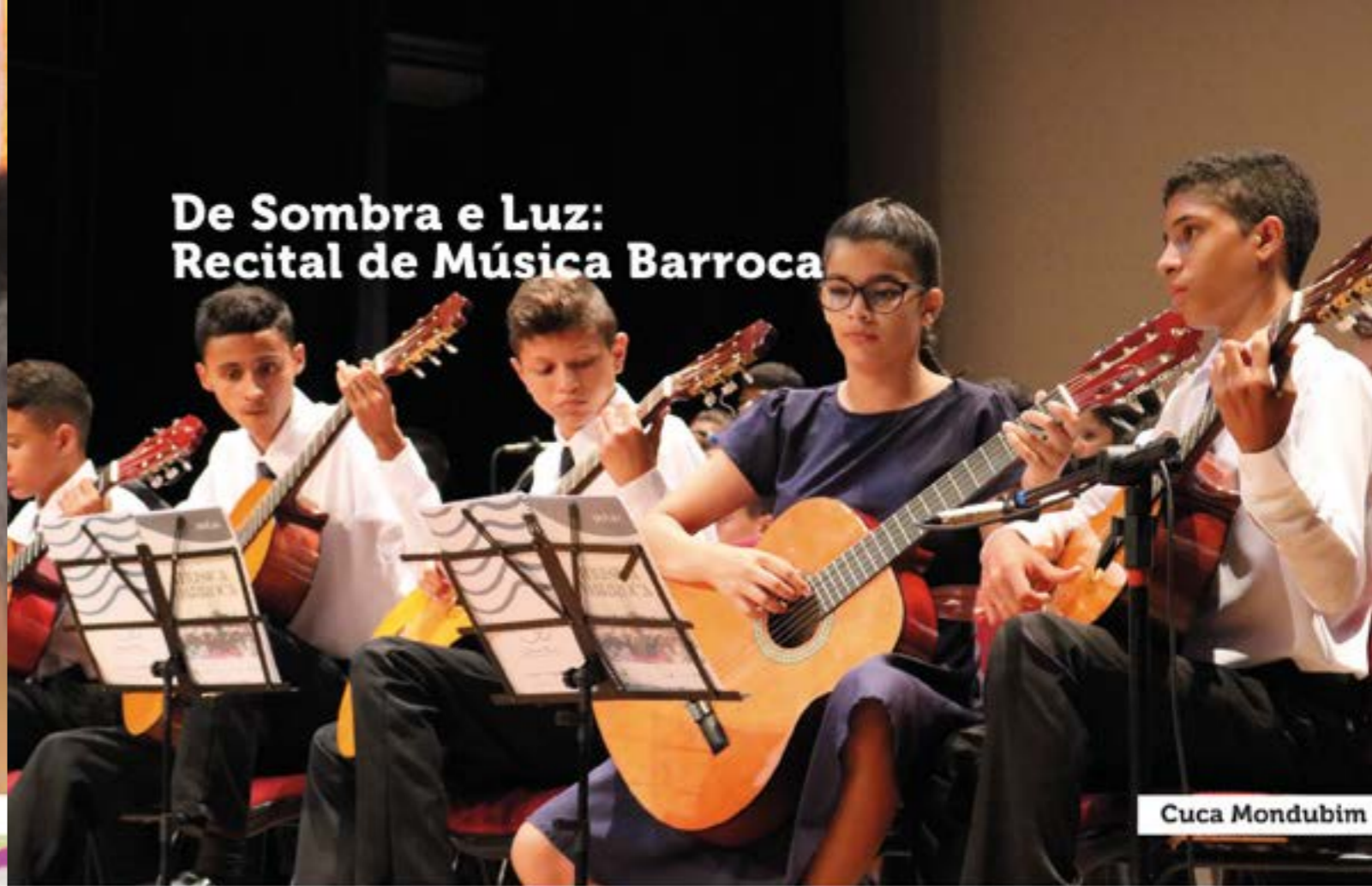
De Sombra e Luz: Recital de Música Barroca