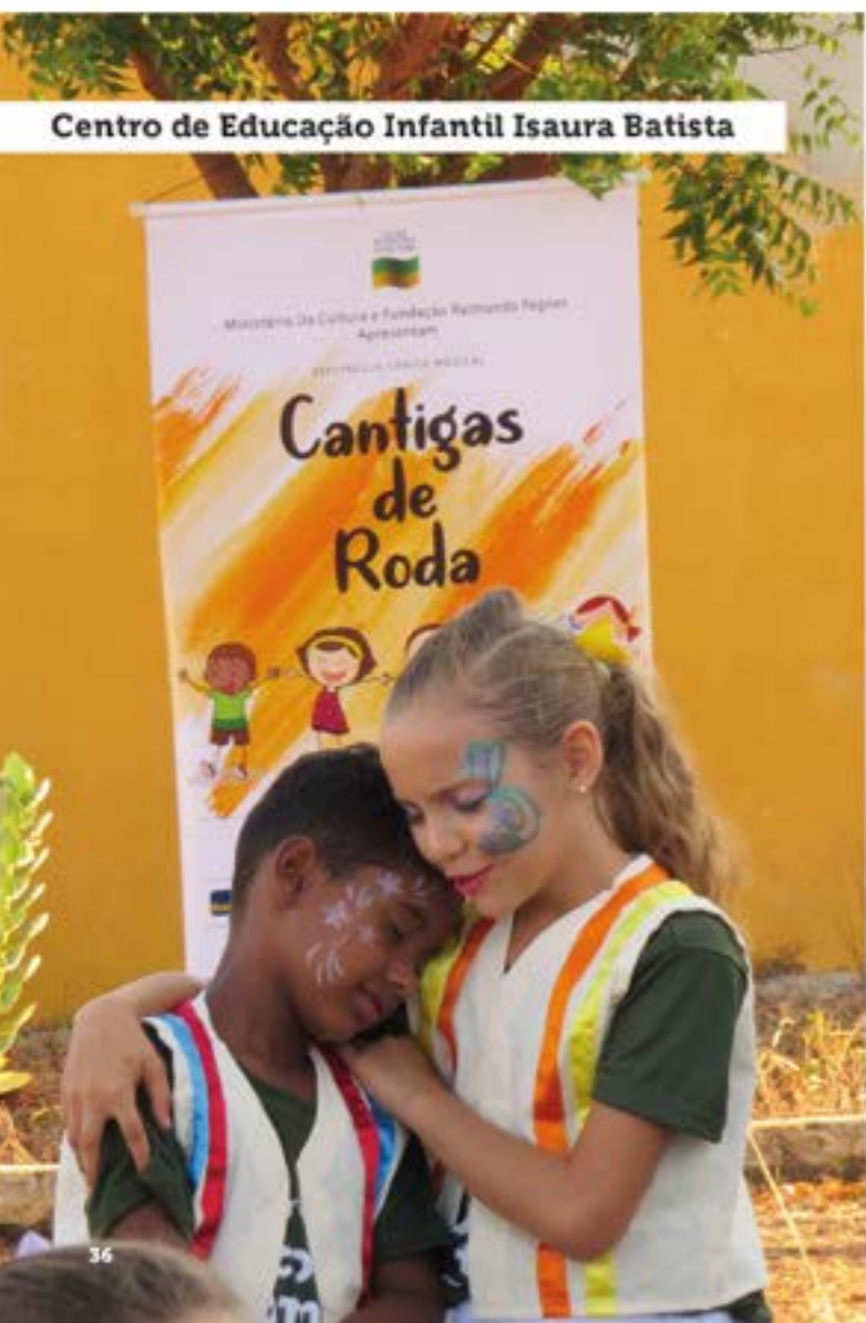
Centro de Educação Infantil Isaura Batista