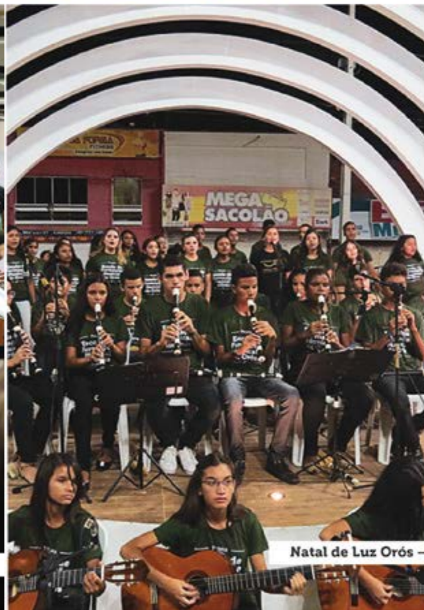
Natal de Luz Orós - Praça Anastácio Maia