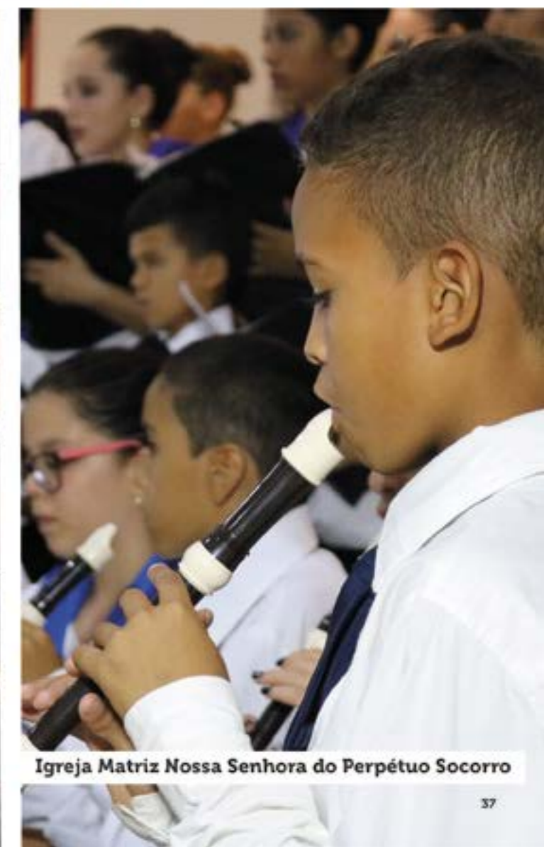
Igreja Matriz Nossa Senhora do Perpétuo Socorro