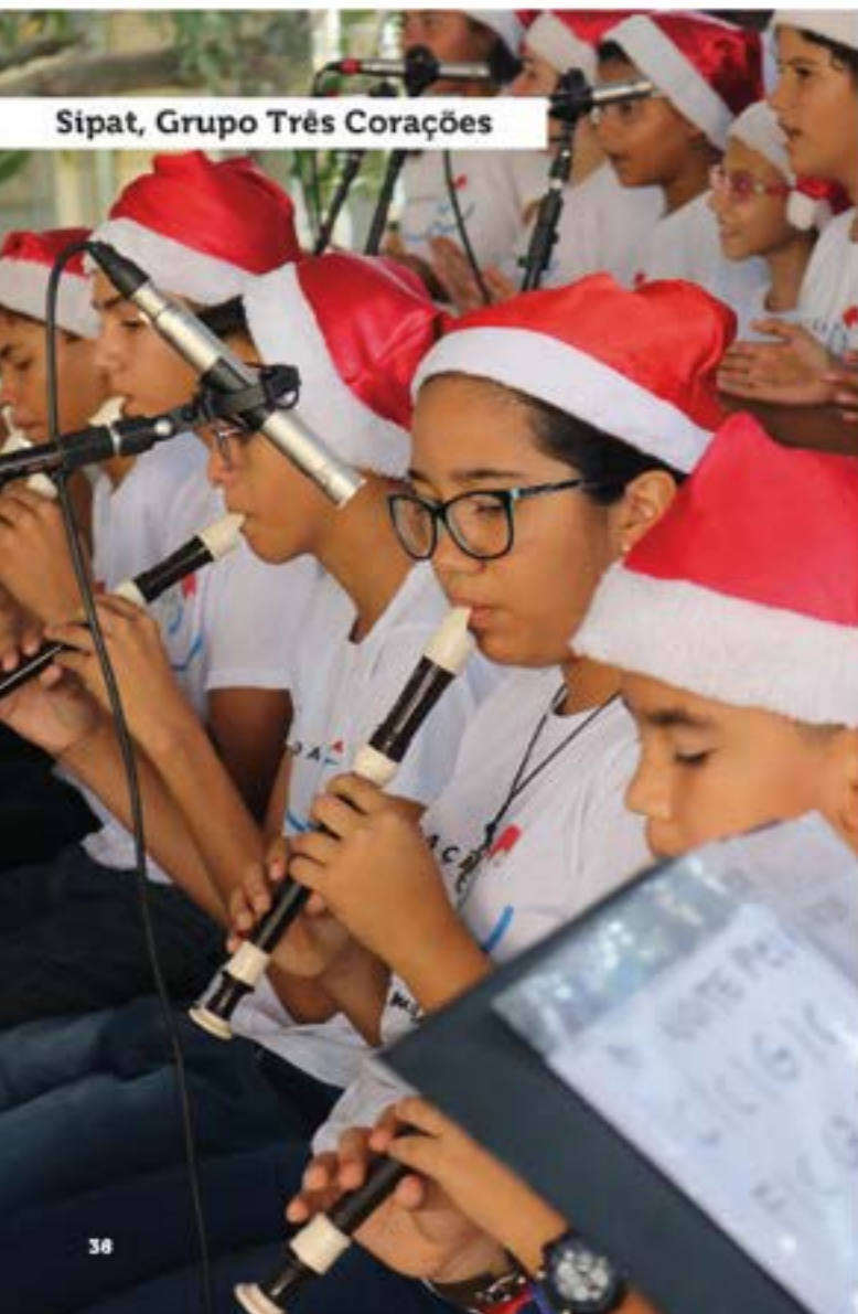
Sipat, Grupo Três Corações