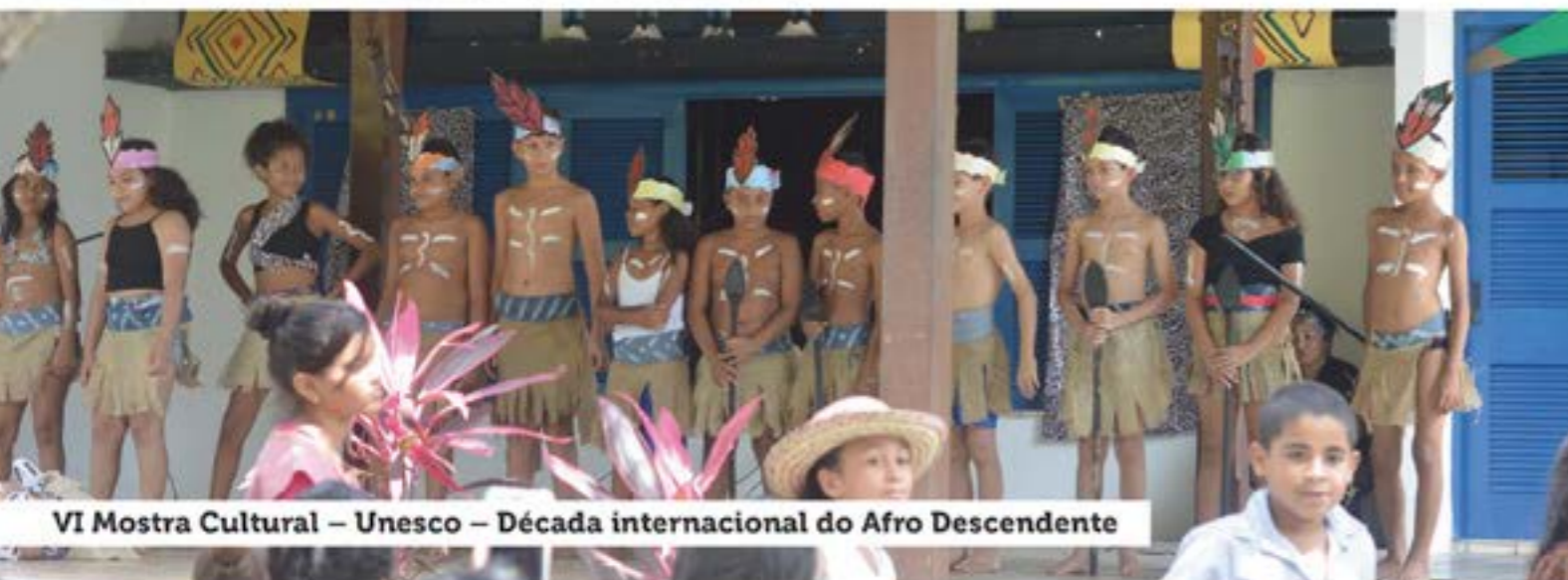
VI Mostra Cultural – Unesco – Década internacional do Afro Descendente