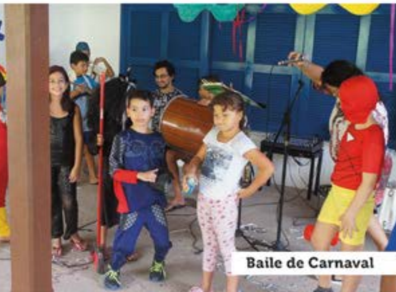
Baile de Carnaval