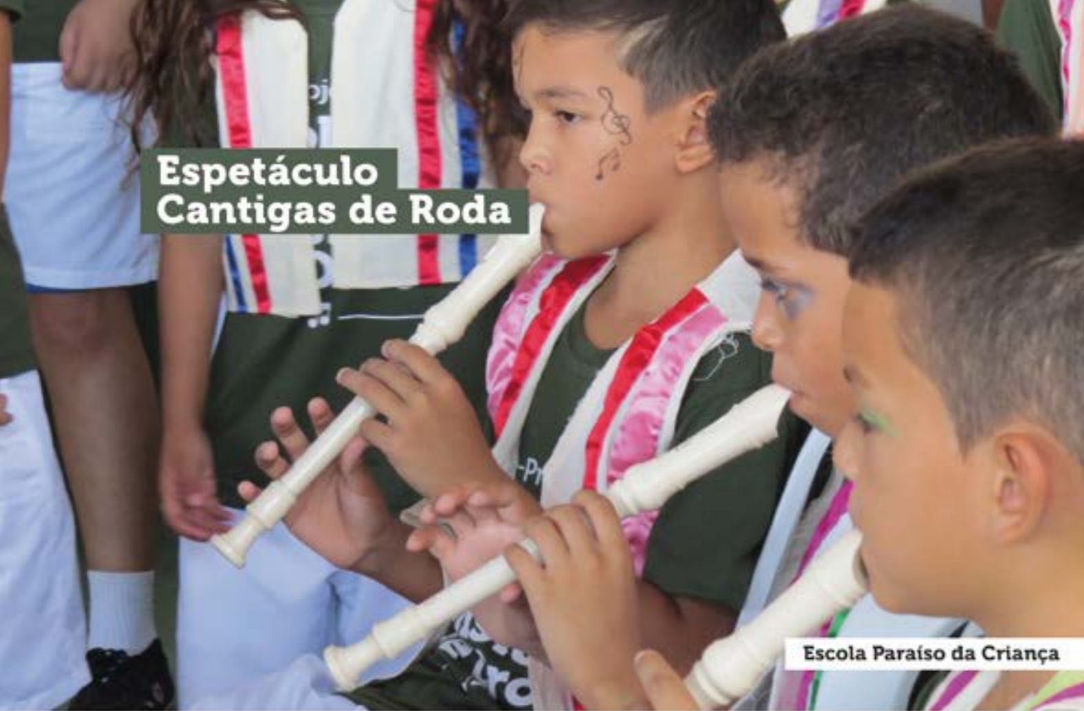
Espetáculo Cantigas de Roda