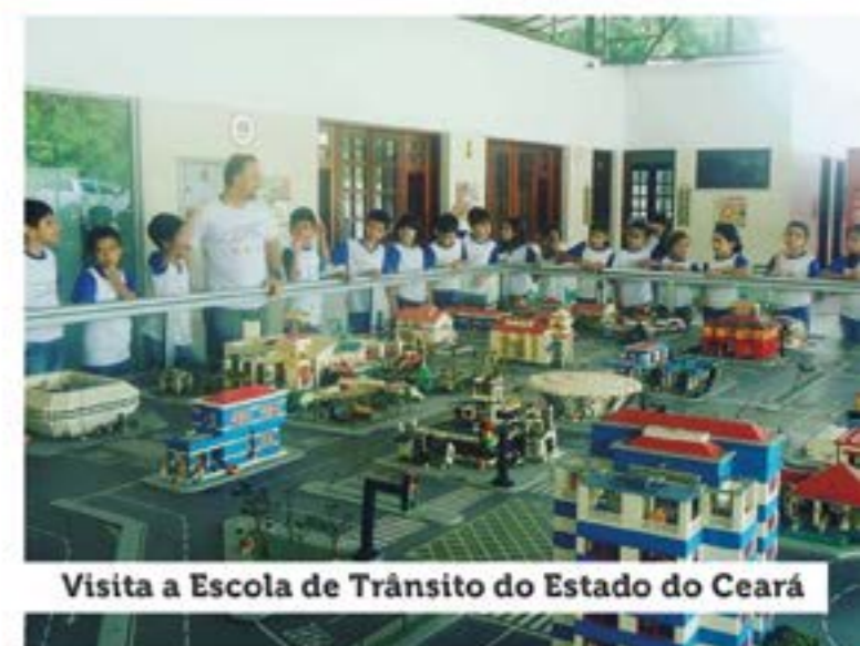
Visita a Escola de Trânsito do Estado do Ceará

crianças e adolescentes; Caminhada contra o trabalho infantil; Mostra Cultural – Sede Orós; Abertura da copa Luis Peixoto; Dia do desafio; Colônia de férias; Tema integrador agosto – folclore; Reunião de pais e Entrega do material; Apresentação na abertura dos jogos do município; Desfile Cívico – aniversário do município; Palestra sobre saúde bucal; Saida Cultural – teatro Ribeira dos Icó; Saúde na praça; Intercâmbio com o Centro do Idoso; Tema integrador setembro – sunset musical; Repertório de Musica Popular – Conferência da Criança e do Adolescente; Dia das crianças; Escrevendo cartas para o papai noel; Residencia Taperas Das Artes; Festival Ibiapaba.