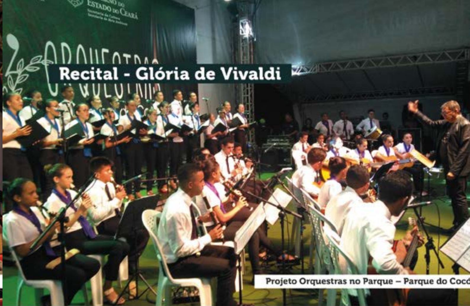
Recital - Glória de Vivaldi