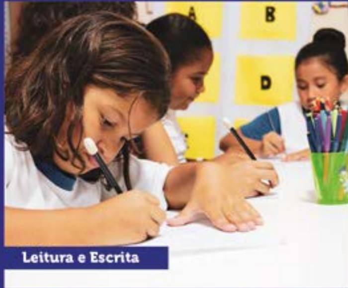
Leitura e Escrita