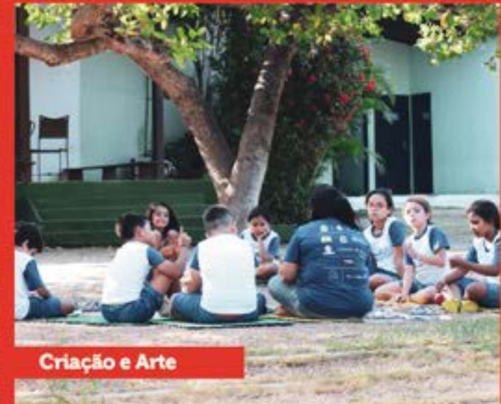
Criação e Arte