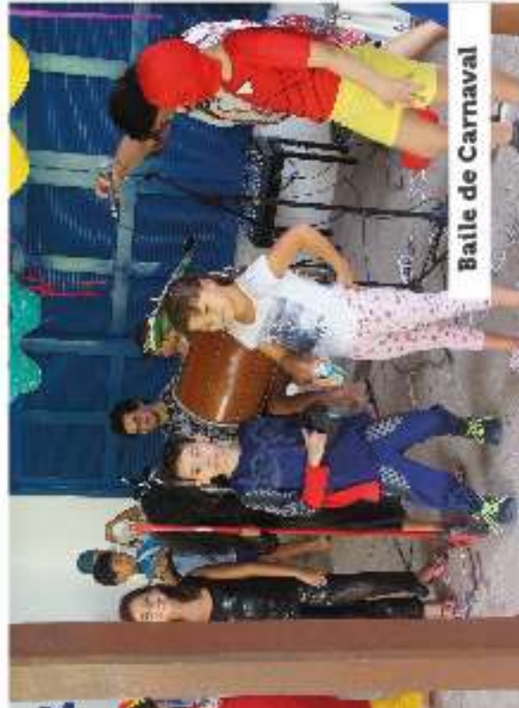
Baile de Carnaval