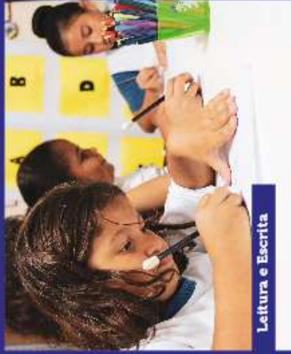
Leitura e Escrita