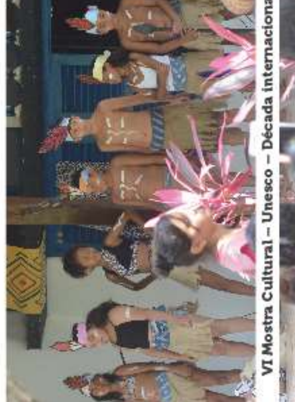
VI Mostra Cultural – Unesco – Década internacional do Afro Descendente

Encontro Pedagógico 2018; Planejamento núcleos; Seleção de novatos; Reunião de pais novatos; Carnaval; Reunião de pais veteranos; Atividade resgatando valores; Palestra da sena da árvore; Caminhada da semana da árvore; Café criativo; Campanha de vacinação; Palestra sobre o combate a exploração sexual; Caminhada contra a exploração sexual; contr