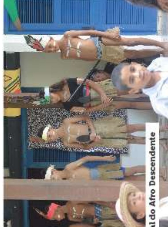
de Saude bucal – Uniodonto; Projeto Educar para Ser – Grupo de mães; Reunião de pais; Atendimento às famílias pelo CRAS; Visita ao Museu do Escravo Liberto – Redenção; VI Mostra Cultural – Unesco – Década internacional do Afro Descendente