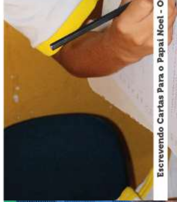
Escrevendo Cartas Para o Papai Noel - O