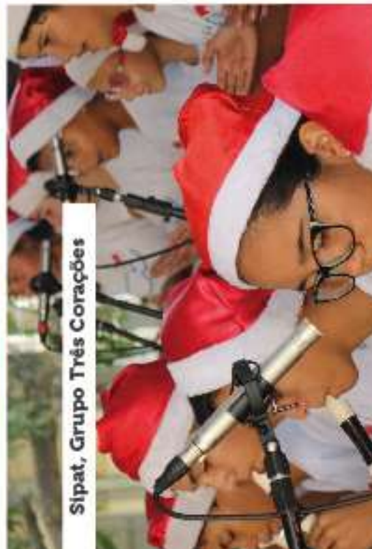
Sipat, Grupo Três Corações