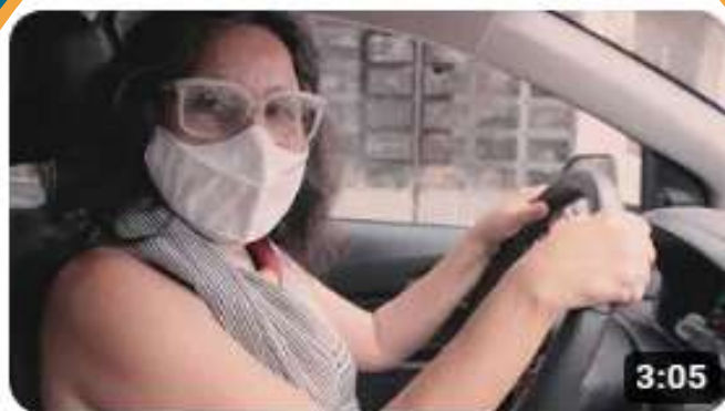
Entrega de Máscaras no CAPS Regional IV - Projeto Sobre Viver...

2.a Sobre Viver Com Arte e Afeto – Este projeto procura atender algumas necessidades da comunidade, especialmente no que diz respeito aos cuidados em saúde mental. Neste sentido, oferece cuidados com as PIC's práticas integrativas e complementares (hipnose, auriculoterapia, massoterapia, reiki, ventosa e arte terapia). Desenvolve ainda, acompanhamento de grupos, orientações e encaminhamentos para equipamentos da Rede de Atenção Psicossocial, atendimento médico semanal com clínico geral, além de grupos de estudo, campanhas educativas sobre cuidados para promoção de saúde física e mental, entre outras ações que acontecem na Fundação ou são levadas para os CAPS de Fortaleza.