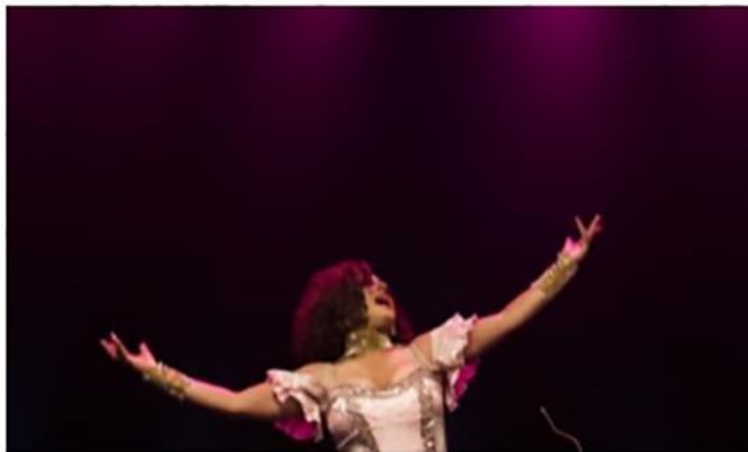
Personagem Camilly Leycker é a protagonista do livro