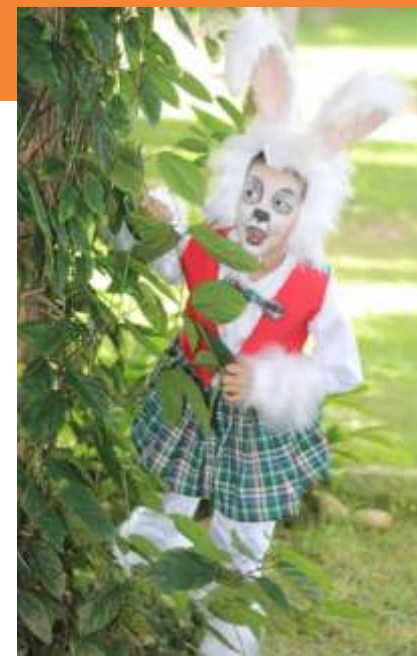
Criação de Figurino do Espetáculo: “Deu a Louca do país das maravilhas” Escola Talentos.