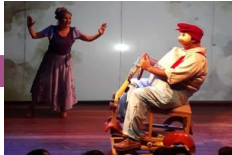
Criação de Figurino do Espetáculo: “A Criança Mais Velha do Mundo” Cia Prisma de Artes, 2019.