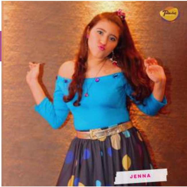
Criação de Figurino do Espetáculo: “De Repende 30” Escola Talentos de Artes.