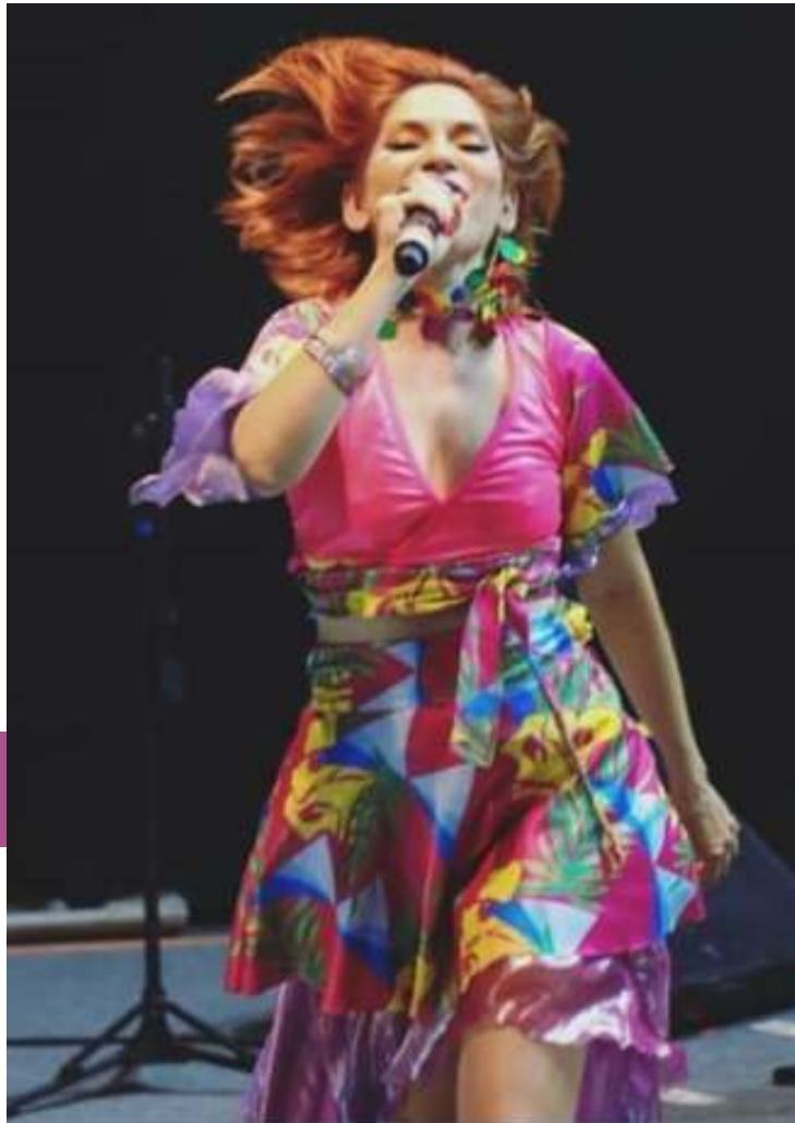
Criação de Figurino do Show: “ Carnaval ” Jord Guedes, 2019.