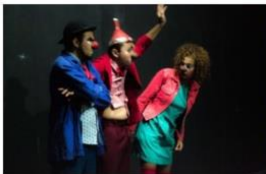
Programação contará com Oficina de Palhaçaria, Mostra de espetáculos e palestra.

Atividade integra programação do XI Festival de Teatro de Fortaleza