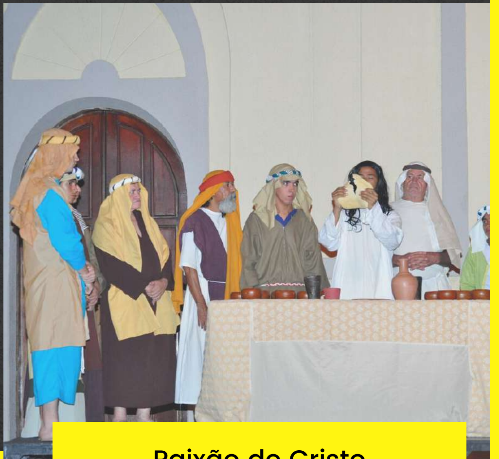
Paixão de Cristo