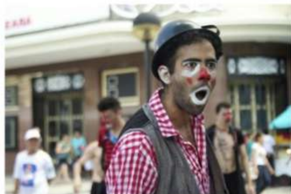
Festival Popular de Teatro de Fortaleza

O Festival Popular de Teatro de Fortaleza (Feptef), idealizado e realizado pela Cia Prisma de Artes, já se prepara para a 12ª edição, que acontece de 16 a 26 de novembro deste ano. O evento é apontado como um dos maiores festivais de teatro exclusivamente de rua do Ceará. A programação não se restringe à apresentação das peças, mas também por meio de oficinas e troca de experiências de grupos de todo o Brasil.