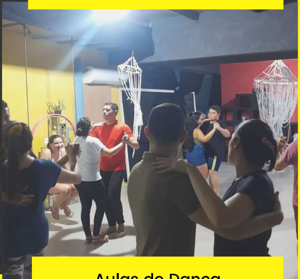
Aulas de Dança