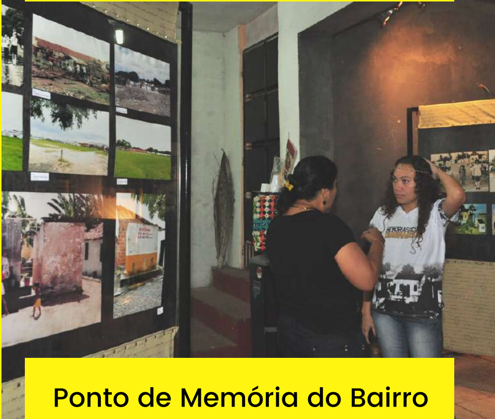
Ponto de Memória do Bairro Dias Macêdo