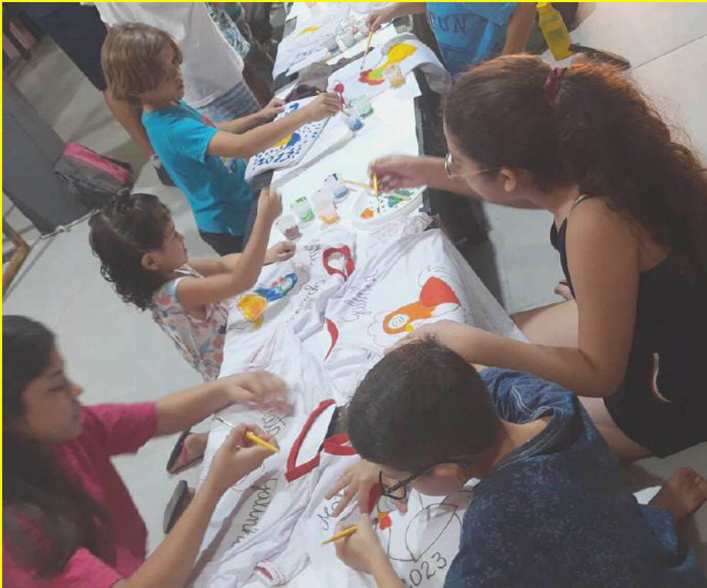
Oficinas artísticas para crianças e jovens