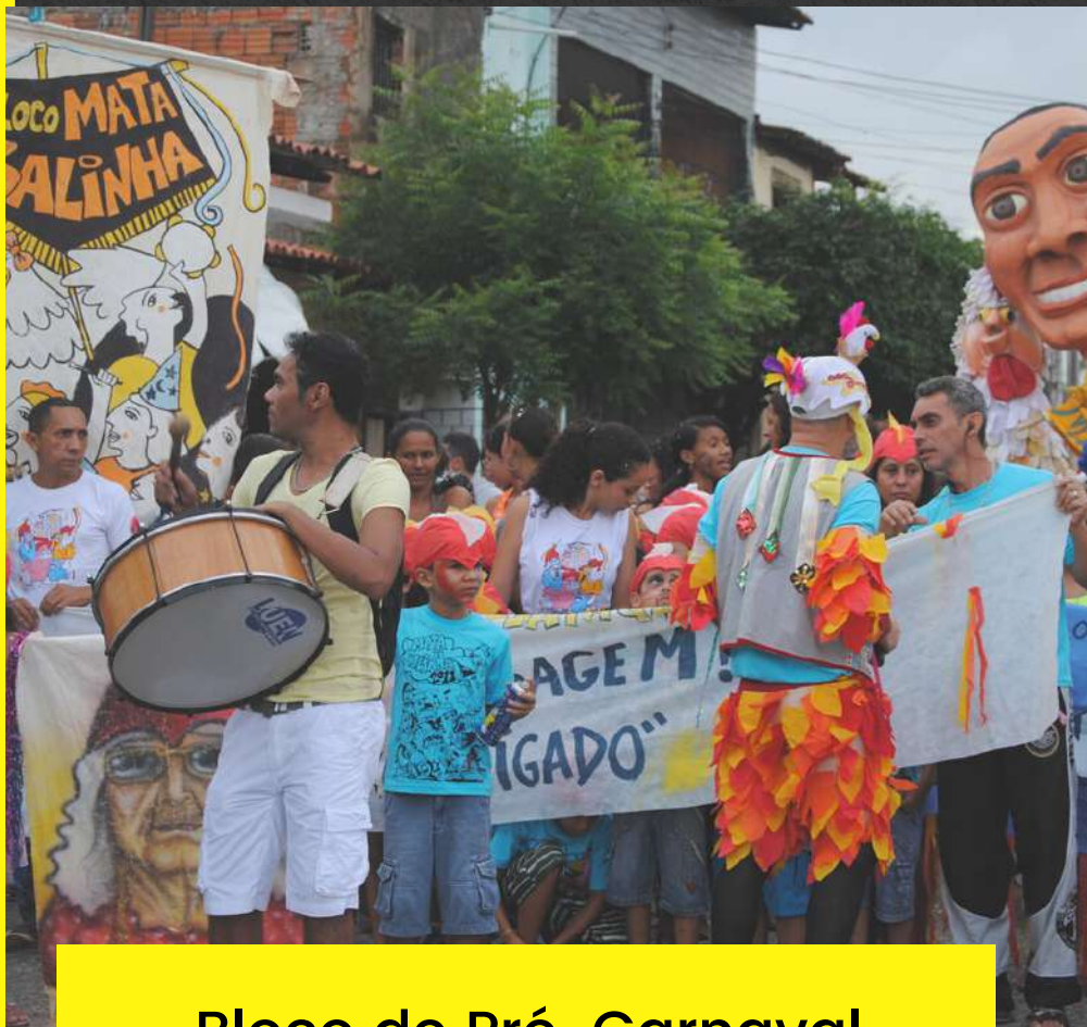
Bloco de Pré-Carnaval