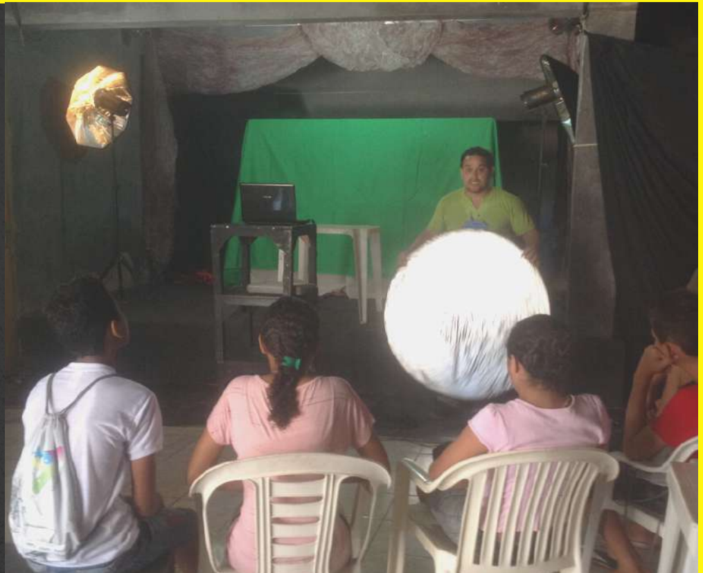
Web TV Comunitária