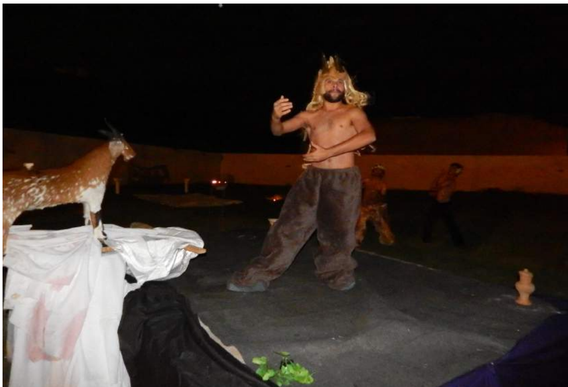
Peça “Dionísio a celebração” de Gilsimar Gonçalves, ano 2015, Direção Gilsimar Gonçalves. Personagem. Dionizio e sátiro.