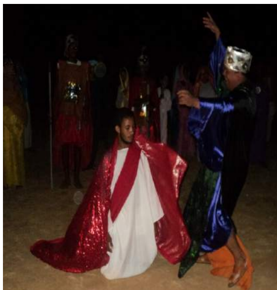
Peça "Retalhos de Minha Terra", de José Gilsimar de oliveira Gonçalves, ano 2011, direção de José Gilsimar de oliveira Gonçalves . Personagem interpretado: Matulão.