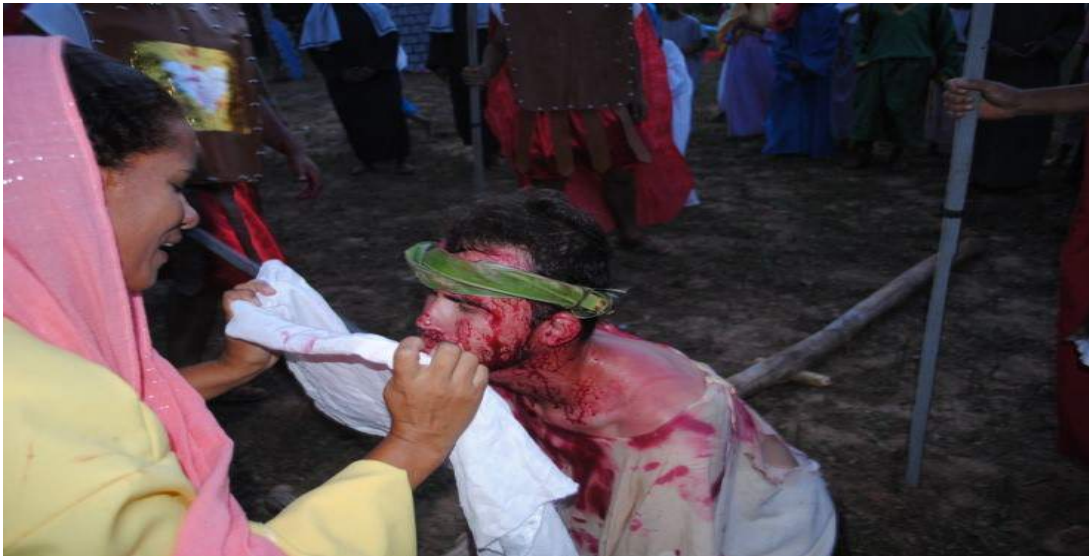
Peça "Retalhos de Minha Terra", de José Gilsimar de oliveira Gonçalves, ano 2010, direção de José Gilsimar de oliveira Gonçalves. Personagem interpretado: Matulão.