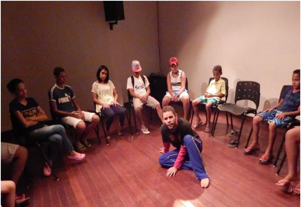
Peça "Auto de natal o anjo do anuncio" de Gilsimar Gonçalves, ano 2017, Direção Gilsimar Gonçalves. Personagem: José.