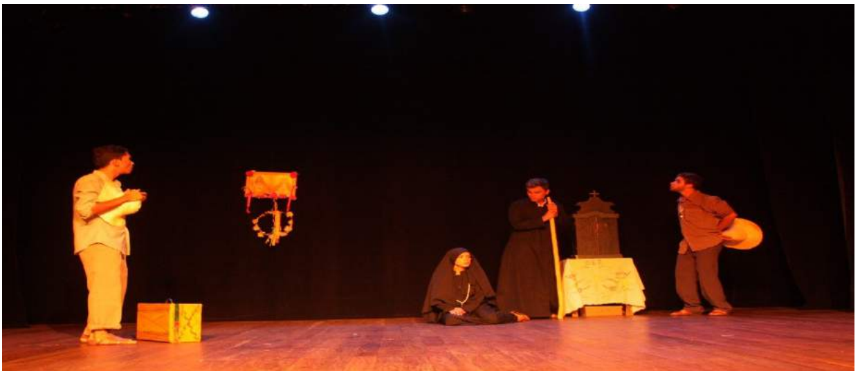
Peça "Retalhos de Minha Terra", de José Gilsimar de oliveira Gonçalves, ano 2012, direção de José Gilsimar de oliveira Gonçalves . Personagem interpretado: Matulão.