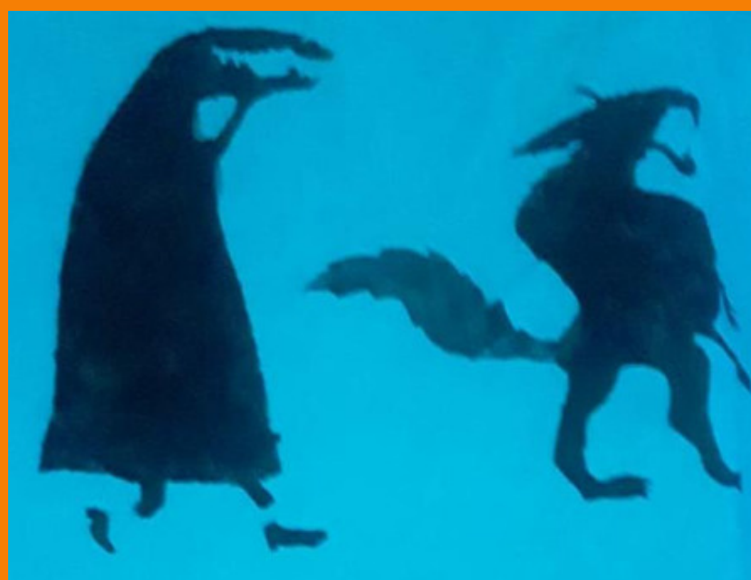
Técnica de pintura em tecido