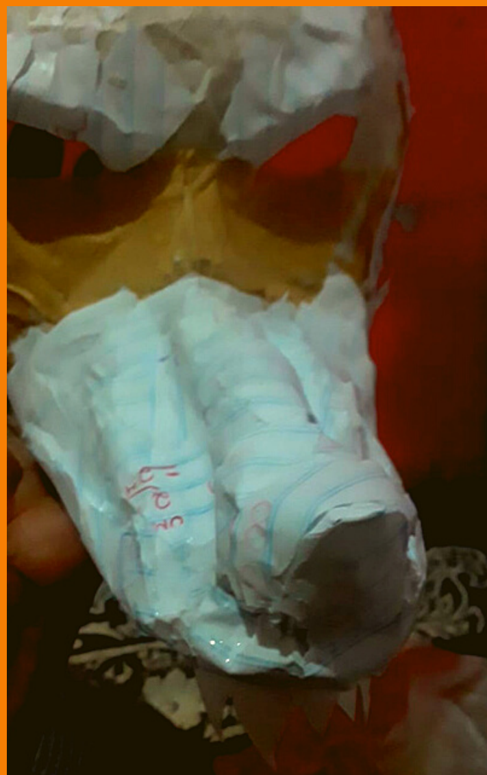
Técnica de papietagem

Uma das mais antigas lendas do Jangurussu é o Lobisomem que ronda nas matas e nas ruas. História contada por muitos moradores que mantém viva no imaginário popular a figura encantada do Lobisomem como o guardião do Jangurussu.