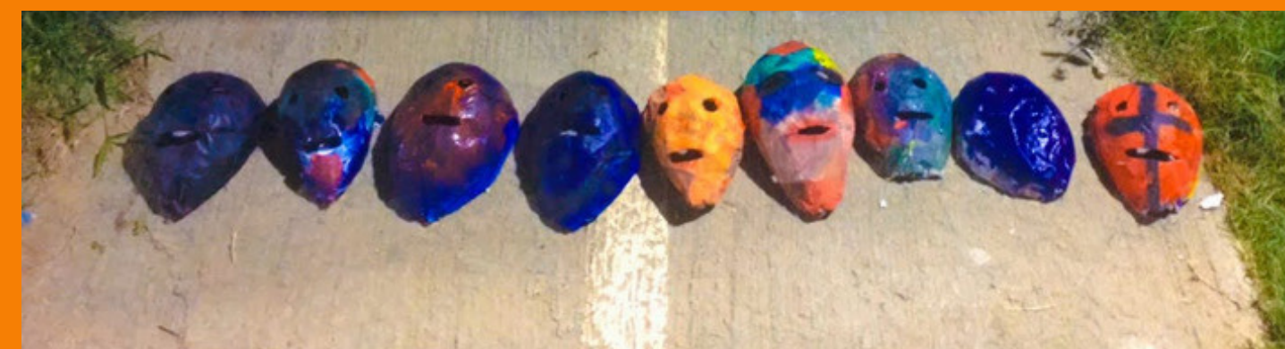
Técnica de papietagem com jornal e grude