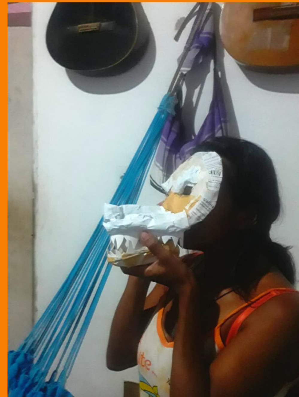
Técnica de papietagem