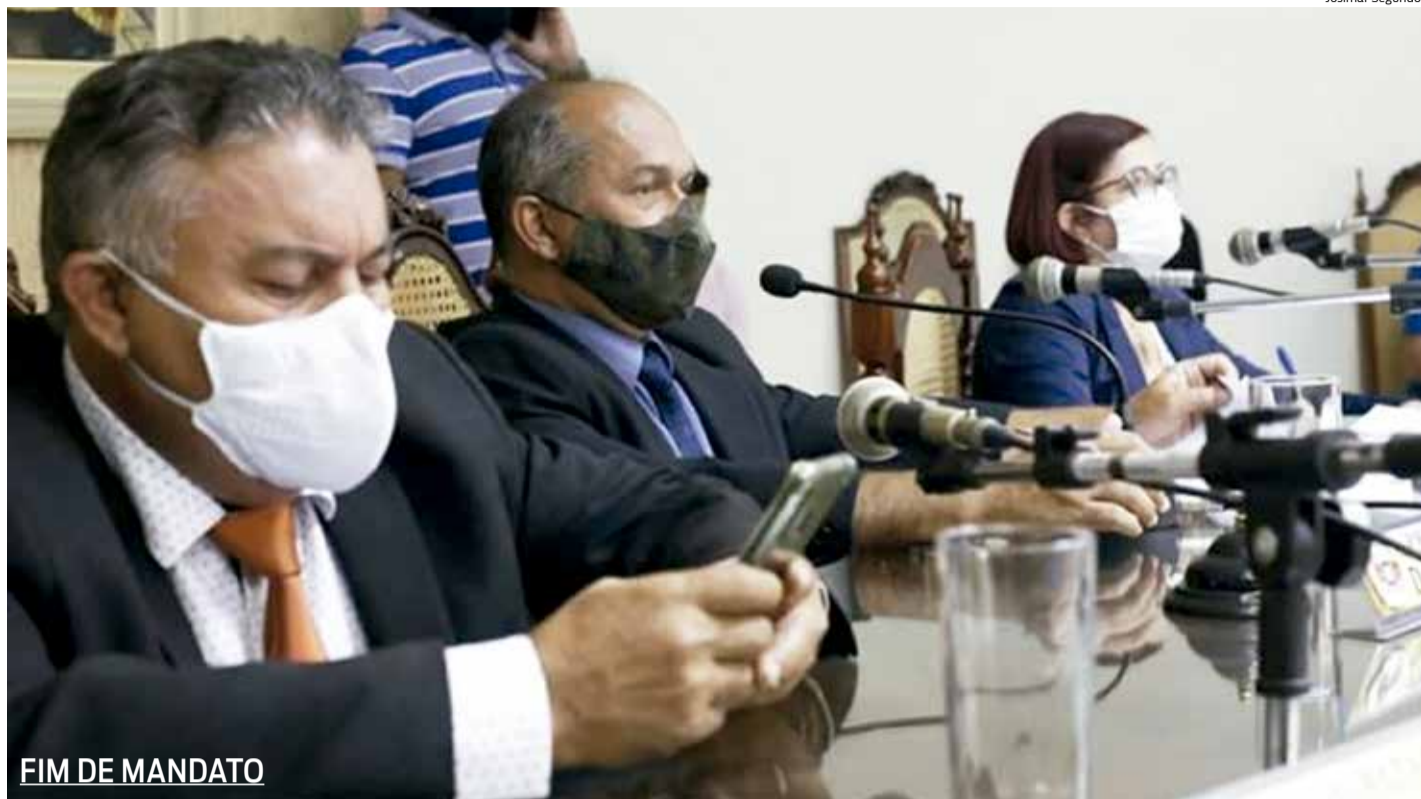
FIM DE MANDATO

► Desculpe a ignorância , os FGs vão insistir em barrar a candidatura do governador Camilo Santana ao Senado Federal?