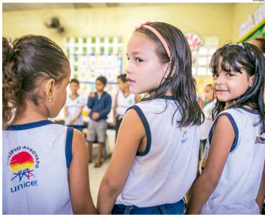
O SELO Unicef é uma iniciativa que visa garantir os direitos das crianças e adolescentes

Esta edição teve início em 2017, quando os gestores municipais assinaram um termo assumindo o compromisso para trabalhar, durante os quatro anos de mandato, pela garantia dos direitos de jovens em situação de vulnerabilidade e também assegurar que o Conselho Municipal da Criança e do Adolescente (CMDCA) esteja funcionando em boas condições. Após a adesão, eles definiram um articulador e um mobilizador de jovens para desenvolver políticas públicas nas áreas da Educação, Saúde, Cultura e Assistência Social e participarem de capacitações e cursos, presenciais e à distância, ofertados pelo equipe do Unicef e parceiros a fim de auxiliar os par-