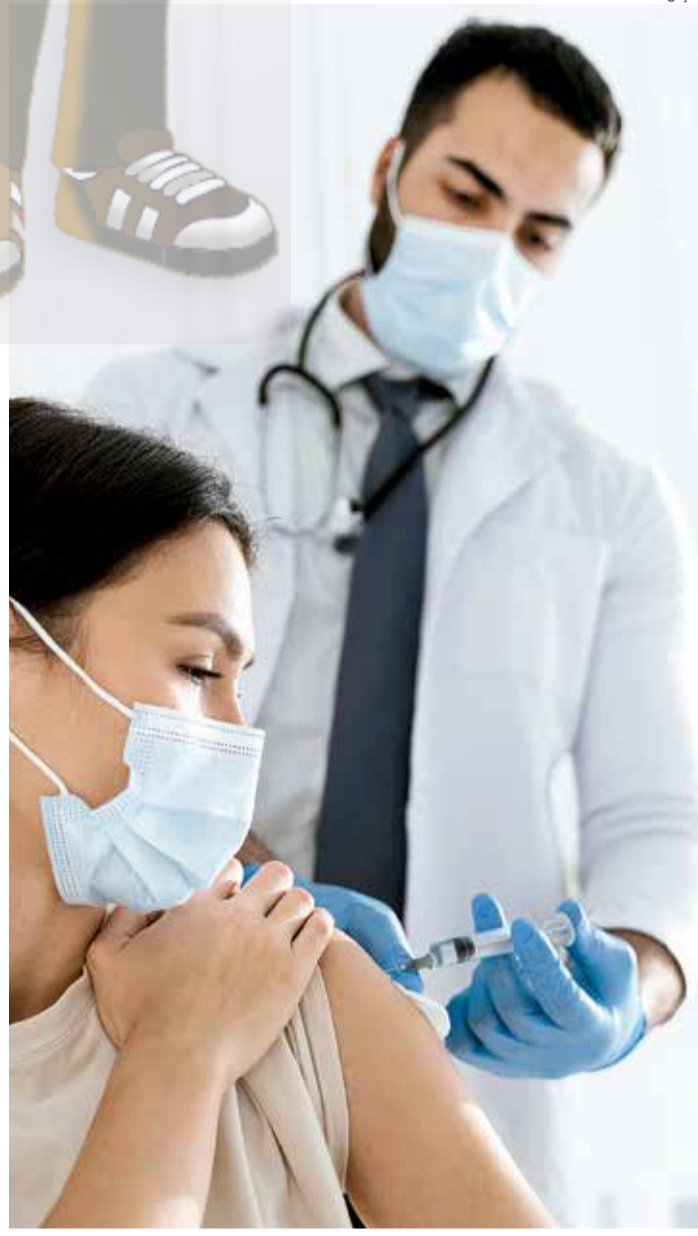
IMUNIZAÇÃO ainda não possui data definitiva para acontecer na região

Apesar de ainda não ter data definida, o Ministério da Saúde pretende que, até o mês de março, comece a distribuição da vacina de Oxford e do Laboratório AstraZeneca, que será produzida no Brasil pela FioCruz.