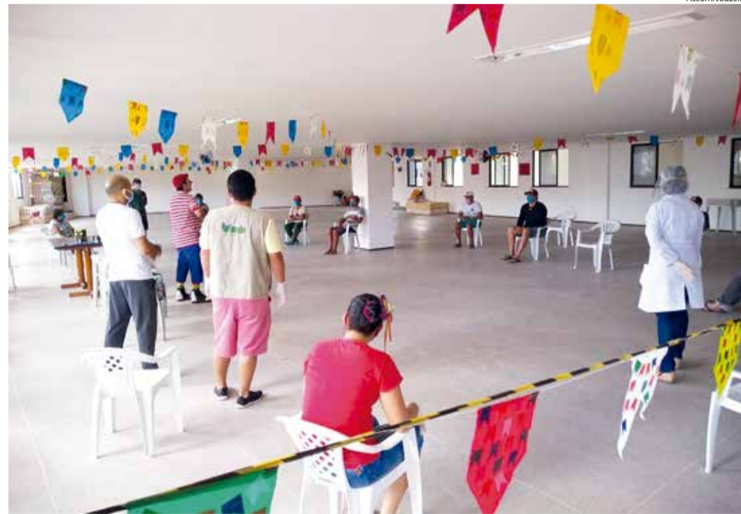
EQUIPE do Caps Ad, de Juazeiro, realizou ações com pessoas em situação de rua durante isolamento social