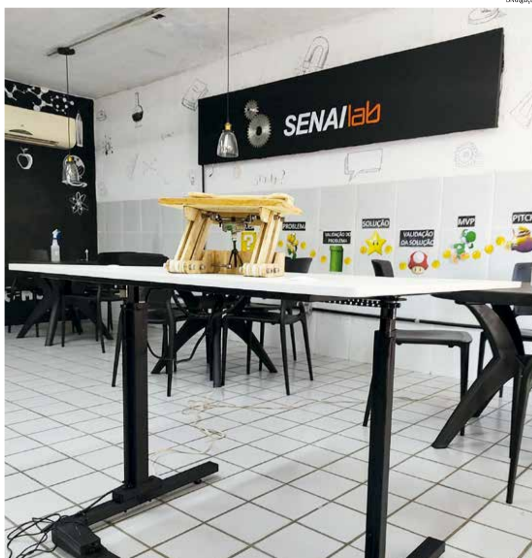
MESA tem como propósito auxiliar o trabalho do usuário e deixá-lo confortável

“Atualmente, o empreendedorismo feminino vem