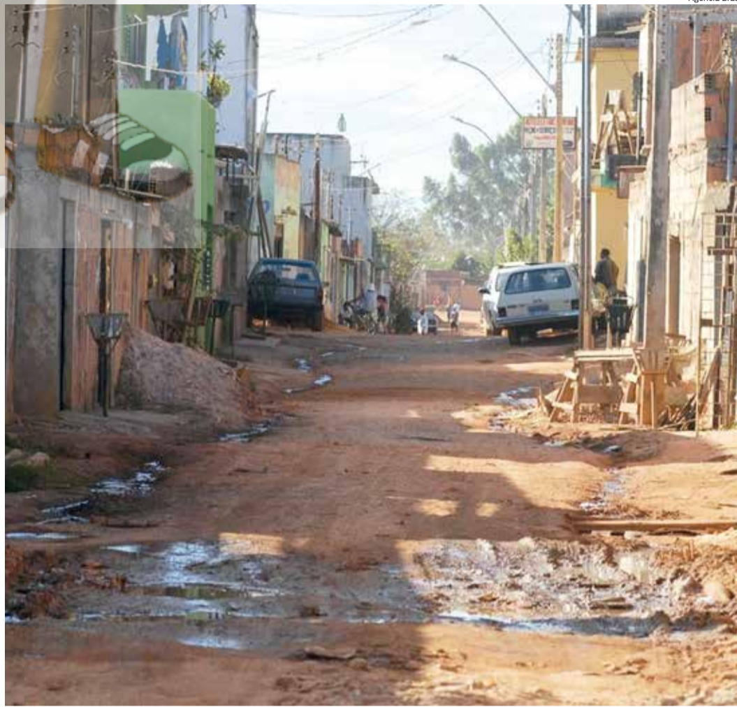
EM 2019, cerca de 47% dos cearenses viviam com até meio salário mínimo