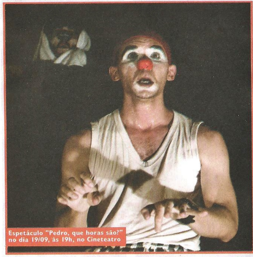
Espectáculo "Pedro, que horas são?" no dia 19/09, às 19h, no Cineteatro