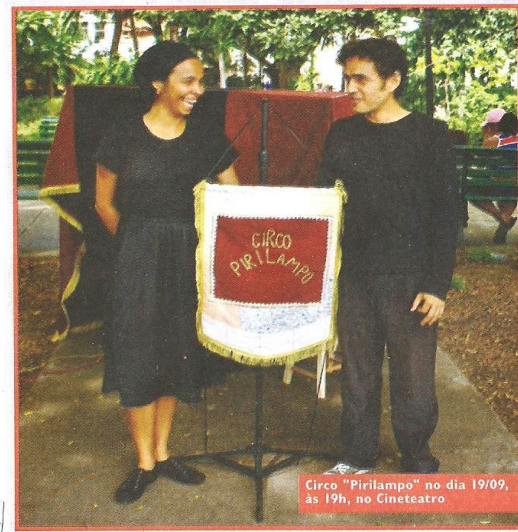
Circo "Pirlampo" no dia 19/09, às 19h, no Cineteatro