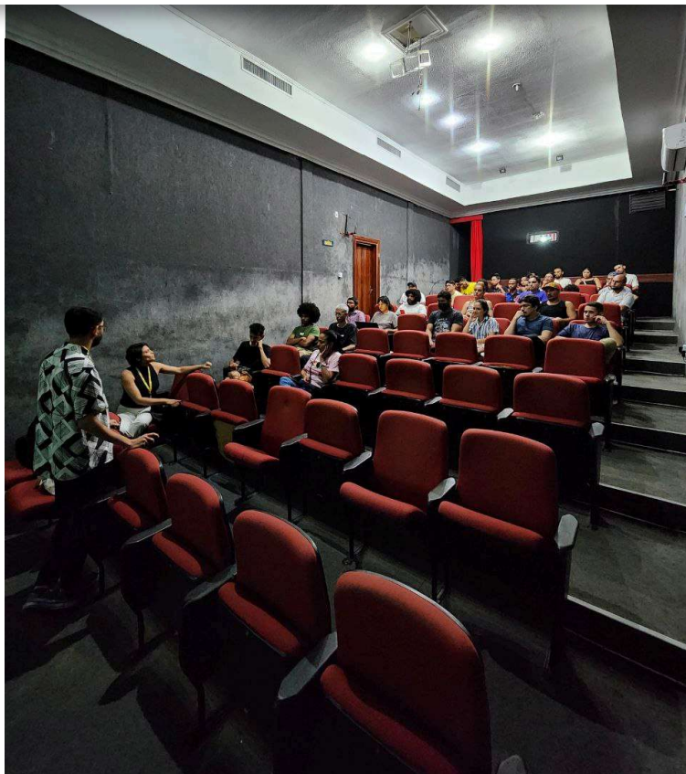
Encontro II - Artes Cênicas, Música, Literatura, Culturas Periféricas e Culturas LGBTQIAPN+, dia 25 de abril de 2023;